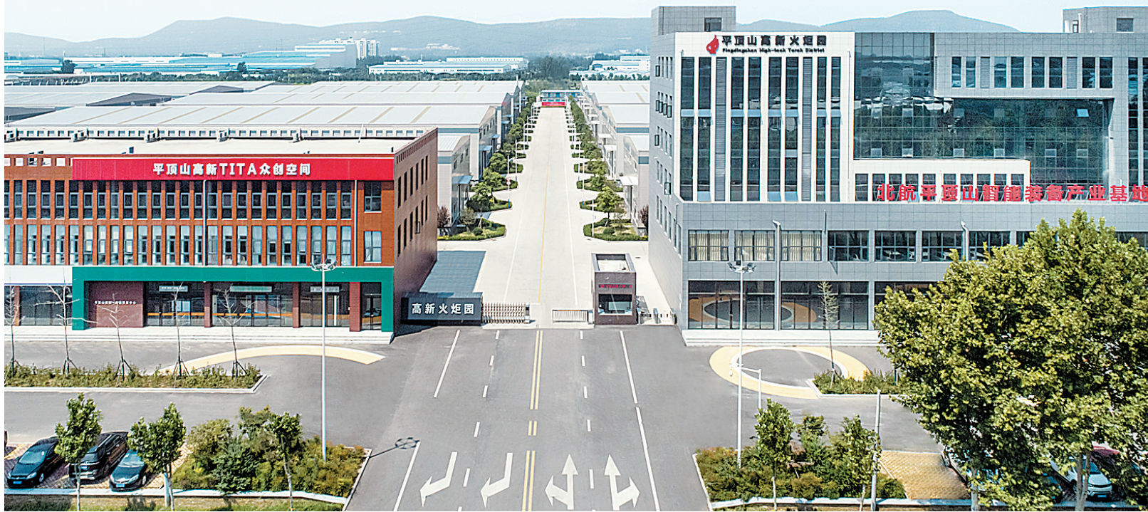
配套设施完善的高新火炬园