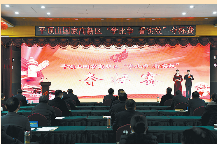
1月7日,高新区举办“学比争 看实效”夺标赛。