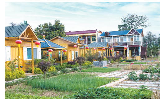
遵化店镇严村一隅

工作稳步推进;代庄幼儿园、小营幼儿园建设稳步施工;各项免疫疫苗接种平均接种率达96.31%;平顶山市第一人民医院高新区分院揭牌运行;“两癌”筛查市定任务于三季度提前完成。