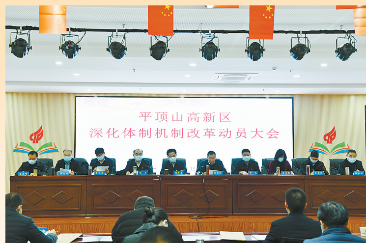
1月9日,高新区召开深化体制机制改革动员会,全面启动第二轮改革。