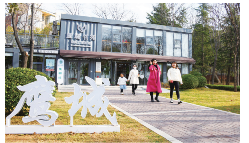
示范区首个鹰城书苑投入使用

建设示范区首个“鹰城书苑”市民广场驿站。按照《2021年平顶山市城市书房建设实施方案》工作部署和要求，西投公司积极探索图书文化服务的新形式，在实地调研、考察周边市民的阅读需求后，建成示范区首个“鹰城书苑”。书苑采用集装箱模块化形式，总建筑面积约216平方米，内设文化、政治、科技、社