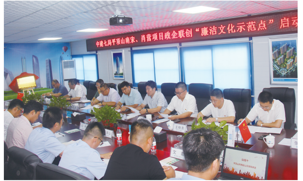
政企联创“廉洁文化示范点”启动