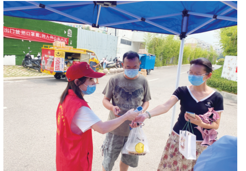
志愿者参与疫情防控