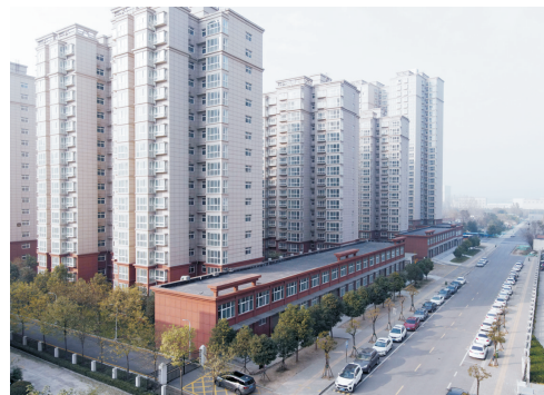
东王营安置小区项目

随着示范区的发展，管委会委托公司负责示范区棚改安置房建设，现已建成的安置小区有4个，分别为西太平安置小区一期、西太平安置小区二期、李庵安置小区、东王营安置小区，总建筑面积约为405万㎡，总投资约8亿元。正在建设的安置房小区3个，分别为东王营安置小区、南宋安置小区、肖营安置小区，总建筑面积约为61.27万㎡，总投资约16.4亿元。为保障项目的顺利推进，公司制定了一套科学、行之有效的《工程管理办法》，负责承建的多个工程被省住房和城乡建设厅评为“河南省优质结构工程”“河南省建筑工程质量标准化示范工地”“河南省建筑工程安全文明标准化示范工地”，被市住房和城乡建设局评为“市级安全文明工地”。