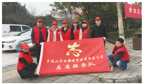
志愿者服务队参与学雷锋活动