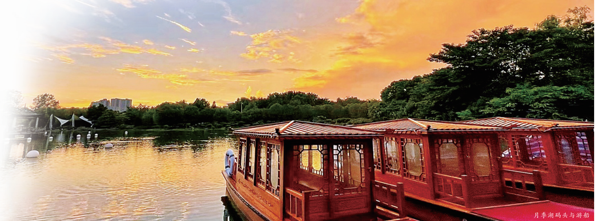
月季湖码头与游船