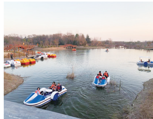
白龟湖国家城市湿地公园游船