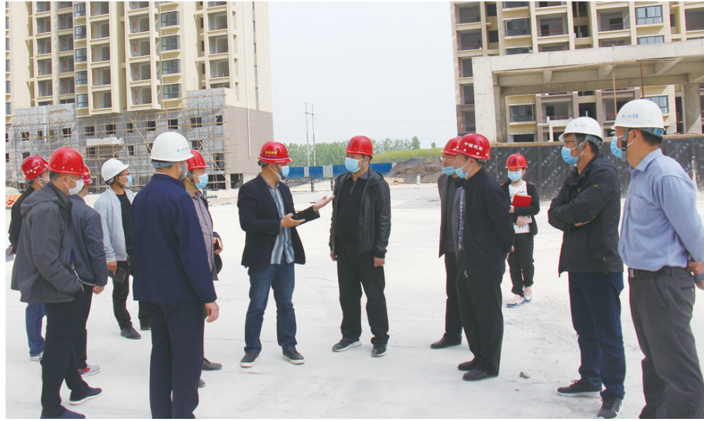
保障房项目建设现场

在示范区管委会领导的关心支持下，董事会带领公司全体职工，以搞好示范区开发建设为己任，紧紧围绕“五年成规模，十年铸精品”的工作目标，开拓进取、顽强拼搏，圆满完成了管委会交办的各项任务，为示范区建设开发作出了积极贡献。