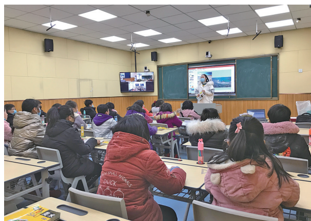
农村教学点专递课堂