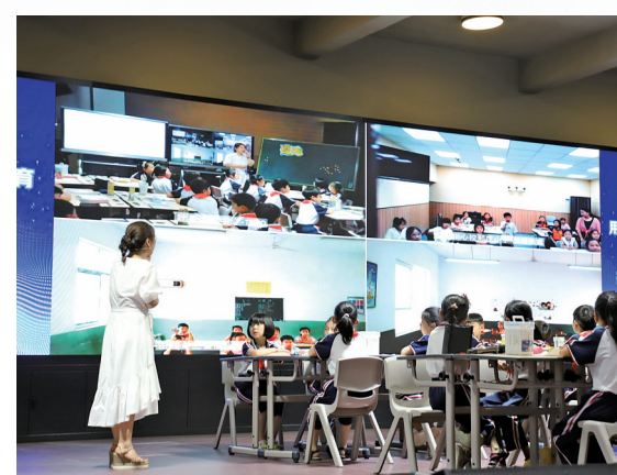
名师课堂课例展示