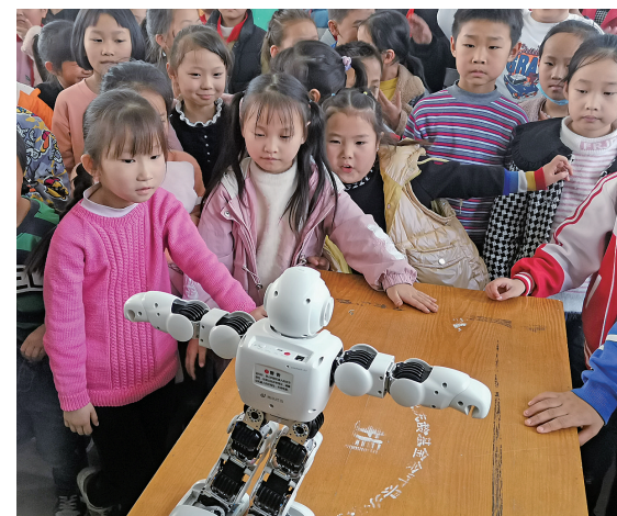
课后服务机器人课程