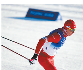
2月6日,俄选手亚历山大·博利舒诺夫在越野滑雪男子双追逐比赛中夺冠。