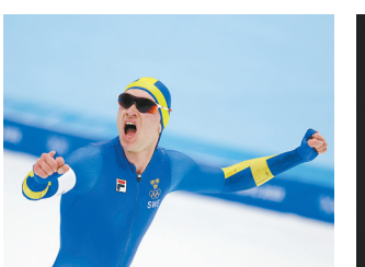
2月6日,瑞典选手尼尔斯·范德波尔在速度滑冰男子5000米比赛中夺冠。