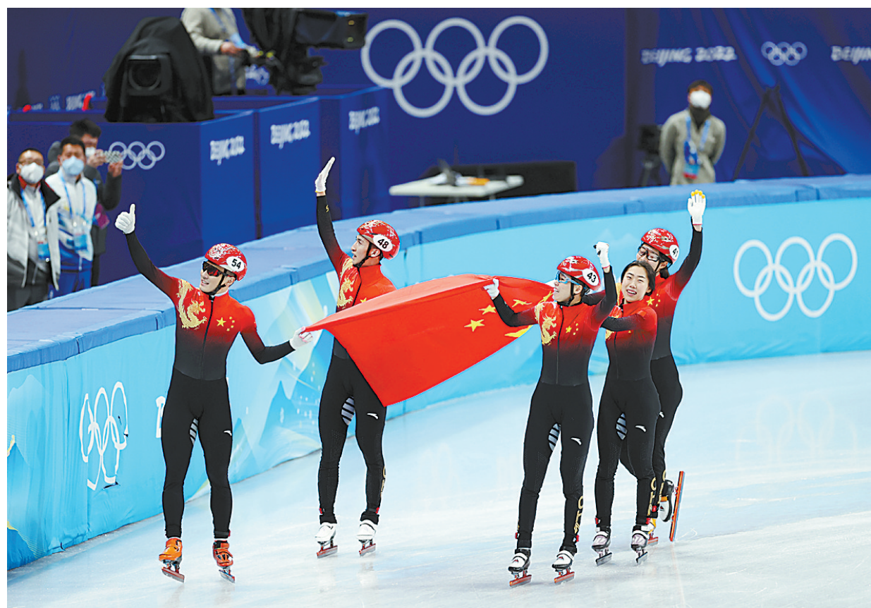
2月5日,中国队选手在比赛后庆祝。