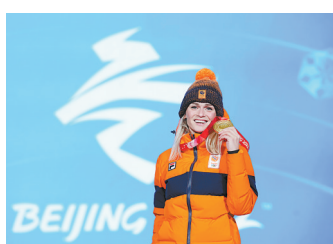
2月6日,荷兰选手伊雷妮·斯豪滕在速度滑冰女子3000米比赛中夺冠。