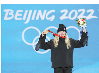
2月6日,新西兰选手佐伊·萨多夫斯基·辛诺特在单板滑雪女子坡面障碍技巧赛中夺冠。