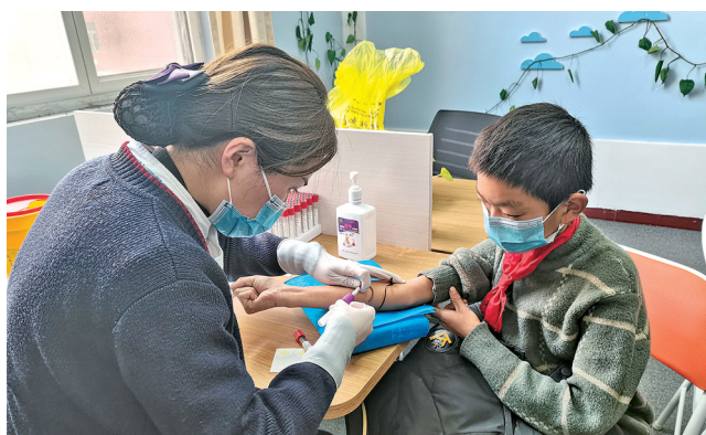
关爱青少年，冬日送温暖。

美年大健康立足鹰城，结合地域常见高发疾病实际，先后成立甲状腺结节会诊中心和肺结节会诊中心，定期组织多学科权威专家为客户提供免费联合会诊服务及后续专业治疗指导方案。强强联合，优势互补，该公司先后与平顶山市第一人民医院、平顶山市第二人民医院、平煤神马医疗集团总医院结成深度医联体、健联体，为顾各开通绿色就诊通道，充分践行“早预防、早发现、早治疗”“防大病、管慢病、促健康”的职业使命，积极履行社会责任。