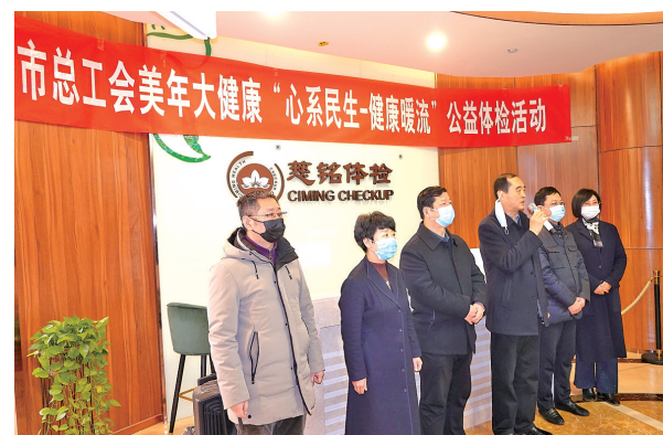
举行公益体检活动