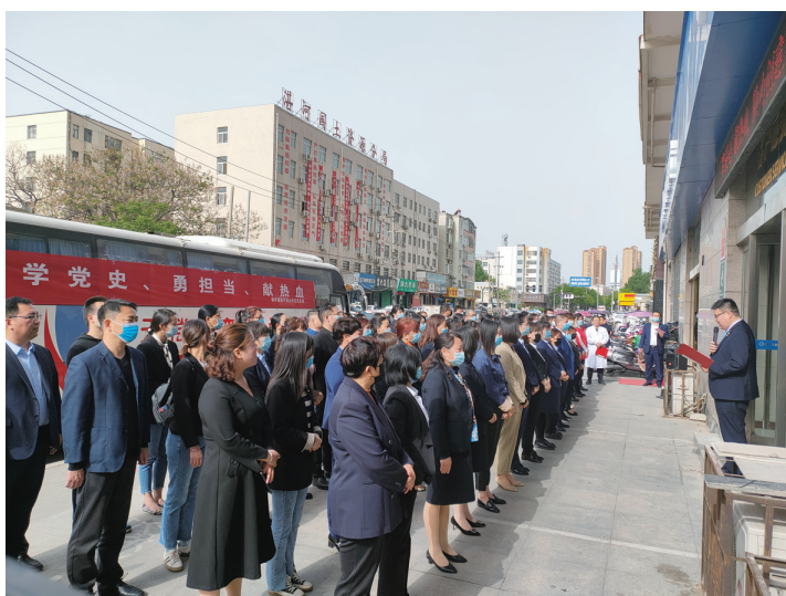
组织无偿献血活动

公司持续深化推进分公司的“星火计划”“燕归巢计划”“鸿鹄后备”“鲲鹏计划”等人才引进和培训项目。这些项目分别面向不同的人才招聘和培养方向,主要着力点是招聘培养保险销售的拓展性人才,以推进销售队伍和组训队