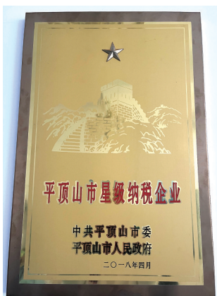
该公司获平顶山市星级纳税企业荣誉

早在2011年，平顶山市中业人力资源服务有限公司就开展有家政服务业务，2019年，河南中业恒信人力资源集团有限公司成立河南中业家政养老服务有限公司，平顶山市中业人力资源服务有限公司的家政业务转移至该公司。