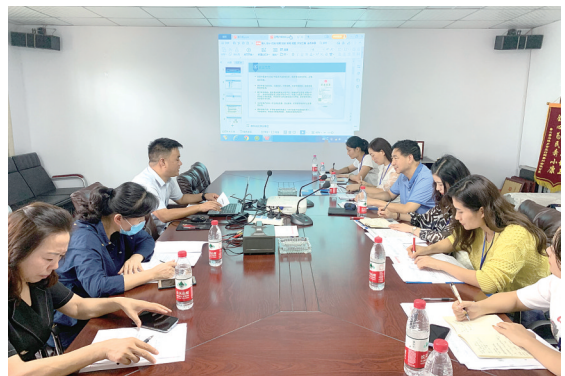
2021年9月，在新华区工信局有关负责人陪同下，该公司工作人员到河南中煤电气有限公司走访，开展面对面座谈，用心了解企业服务需求。