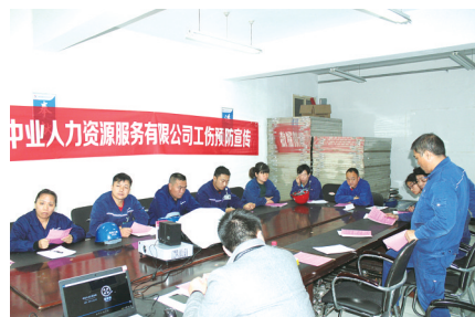
该公司开展工伤预防宣传

去年11月8日，人力资源和社会保障部等部门联合发布《关于推进新时代人力资源服务业高质量发展的意见》，其中提出：人力资源服务业是为经济社会发展提供人力资源流动配置服务的现代服务业重要门类，对促进社会化就业、更好发挥我国人力资源优势、服务经济社会发展具有重要意义。