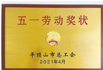
该公司获颁“五一劳动奖状”

断：2018年获评首批“中国中原人力资源服务产业园区入驻单位”，被评为第三届平顶山市非公有制经济人士优秀中国特色社会主义建设者，被评为新华区全省三星特色商业区优秀企业；2019年，被评为2019河南民营企业现代服务业100强；2020年，被市总工会评选为全市模范劳动关系和谐企业；2021年获颁平顶山市“五一劳动奖状”，被命名为“平顶山市工人先锋号”。2020年，其全资子公司平顶山市中业人力资源服务有限公司被评为“河南省中小企业公共服务平台”。