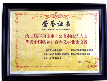
该公司获评第三届平顶山市非公有制经济人士优秀中国特色社会主义事业建设者

截至目前，该公司在平顶山多个县(市、区)均设有分支办事处。公司位于矿工路与诚朴路交叉口东城国际1号楼，以打造“中业家政养老”品牌为核心，先后建立了以下岗女工为主力