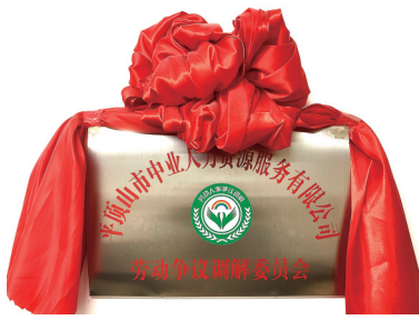
该公司成立劳动争议调解委员会

问什么？问需求。详细询问、了解用人单位的实际情况，对症下药。根据每个用人单位的需求，该公司提供“定制化”服务，并从提高合规意识、降低用工风险等