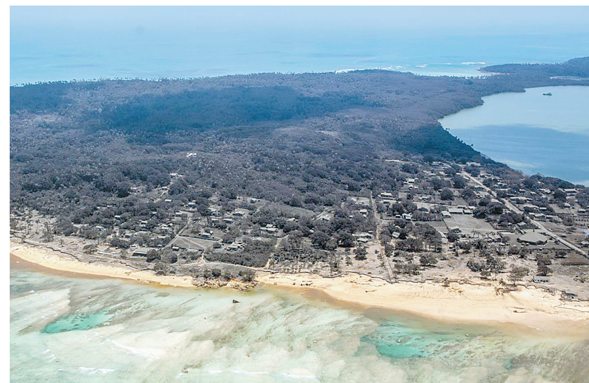
▲1月17日拍摄的汤加主岛汤加塔布岛 ▶1月18日,新西兰海军惠灵顿号舰(左)从位于奥克兰的德文波特军港启航前往汤加,准备提供以淡水为主的救援物资。

据新华社北京1月18日电 南太平洋岛国汤加的洪阿哈阿帕伊岛近日发生火山喷发。澳大利亚和新西兰多名专家分析认为,这可能是30年来全球规模最大的一次海底火山喷发。