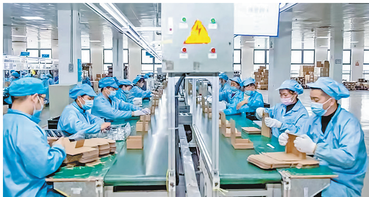
工人在位于市城乡一体化示范区平新产业集聚区的河南首翔电子有限公司车间内包装通信终端产品

完成老旧小区改造 34626 户 农村危房改造 268 户 农房抗震改造 1500 户 15 个疑难复杂楼盘全部进入化解程序