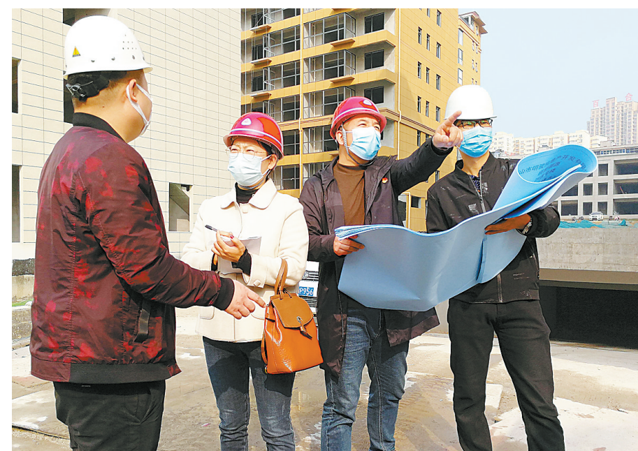
西市场街道工作人员在一项目工地走访。

新华区把“万人助万企”活动作为推进项目建设的务实举措和撬动实体经济发展的引擎，认真抓好工业企业和经济运行精准统计调度工作。11月2日、3日，该区先后召开重点项目推进会、工业经济运行分析会，组织发改、统计、工信、财政等部门深入镇（街道、管委会）、重点企业排查走访，落实新“四上”企业拟入库工作，具