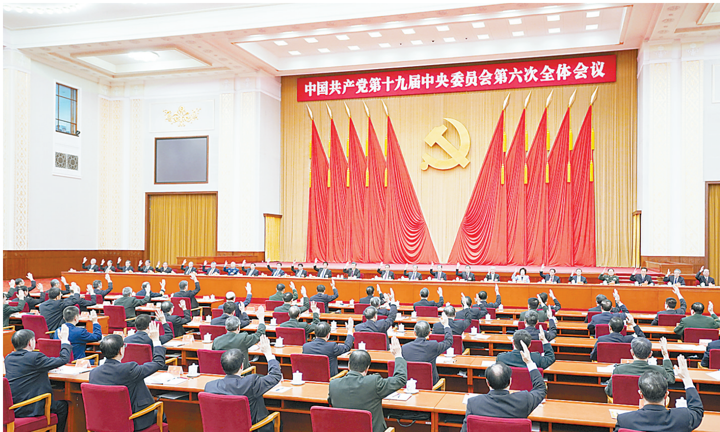
中国共产党第十九届中央委员会第六次全体会议，于2021年11月8日至11日在北京举行。中央政治局主持会议。