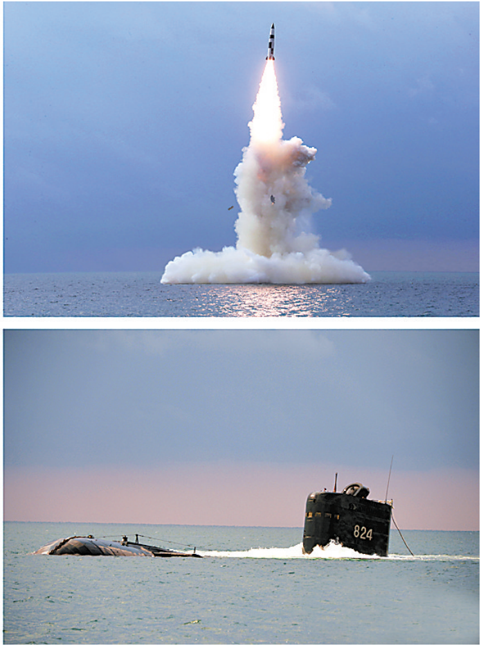
朝鲜成功试射新型潜射弹道导弹