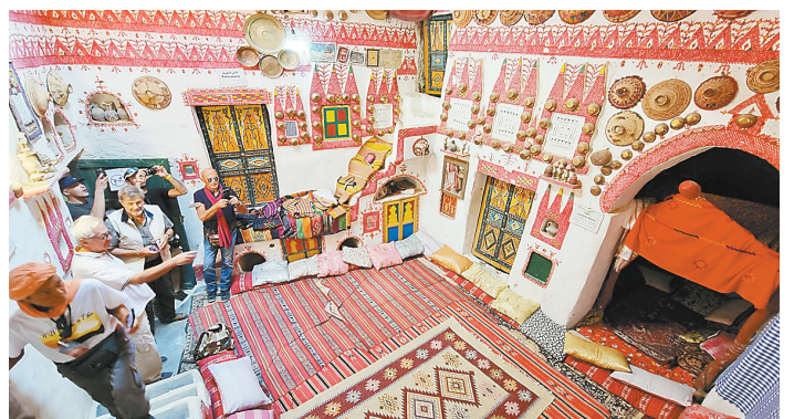
利比亚迎来近10年首批欧洲团队游客

民转场到当地,进行畜产品交易等。今年以来,蒙古国21个省中约一半的省份报告了口蹄疫疫情。目前相关部门正采取隔离和为牲畜接种口蹄疫疫苗等措施,以遏制疫情进一步蔓延。畜牧业是蒙古国经济主要支柱之一。然而,近年来蒙古国多次发生口蹄疫疫情,给当地畜牧业发展造成严重影响。