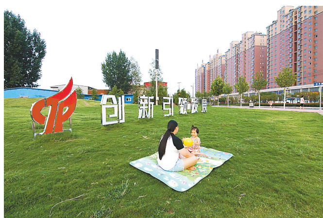
居民在绿色环绕的街头广场休息