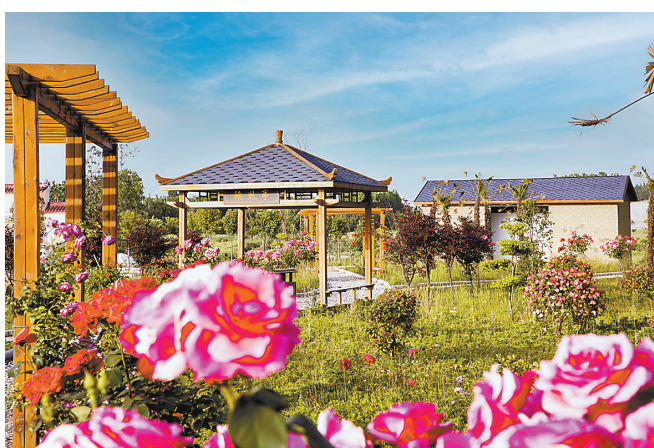
首个生态农场项目——滨河田园生态农场花园锦簇