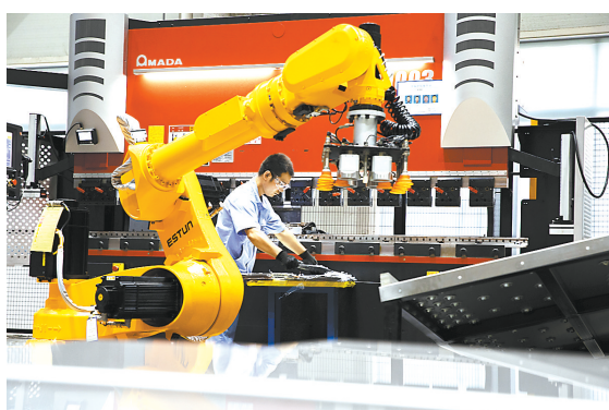
国际先进的自动化生产线

该区还以提升农村人居环境为目标，整治人居环境和卫生死角，加强农村基础设施建设，优化公交线路，让村民的生产生活更便捷更舒适。2020年，遵化店镇形象宣传片在央视播出，获评全省第一批“美丽小镇”，西赵村获评市第二届“十大美丽乡村”，严村获评市森林村，屈庄等14个村获评市卫生村。今年9月6日，农业农村部发布拟认定第二批全国乡村治理示范村镇名单，严村名列其中。