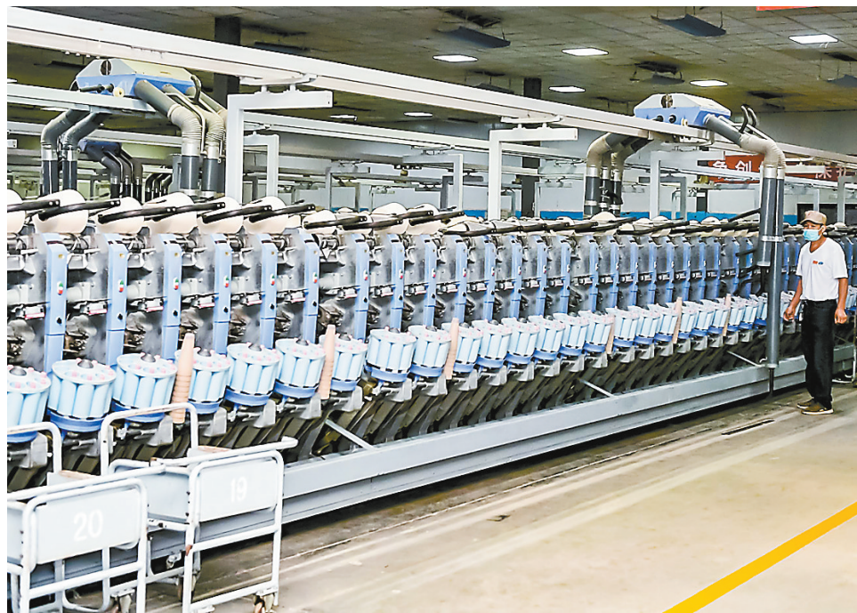
生产线智能化改造

为鼓励先进、充分发挥先进典型的带动作用,该县还表彰了叶县2021年度“十佳种植大户”“十佳养殖大户”“十佳乡村振兴带头人”“十佳新型农业经营主体”“十佳村级集体经济组织”等先进个人和先进集体。