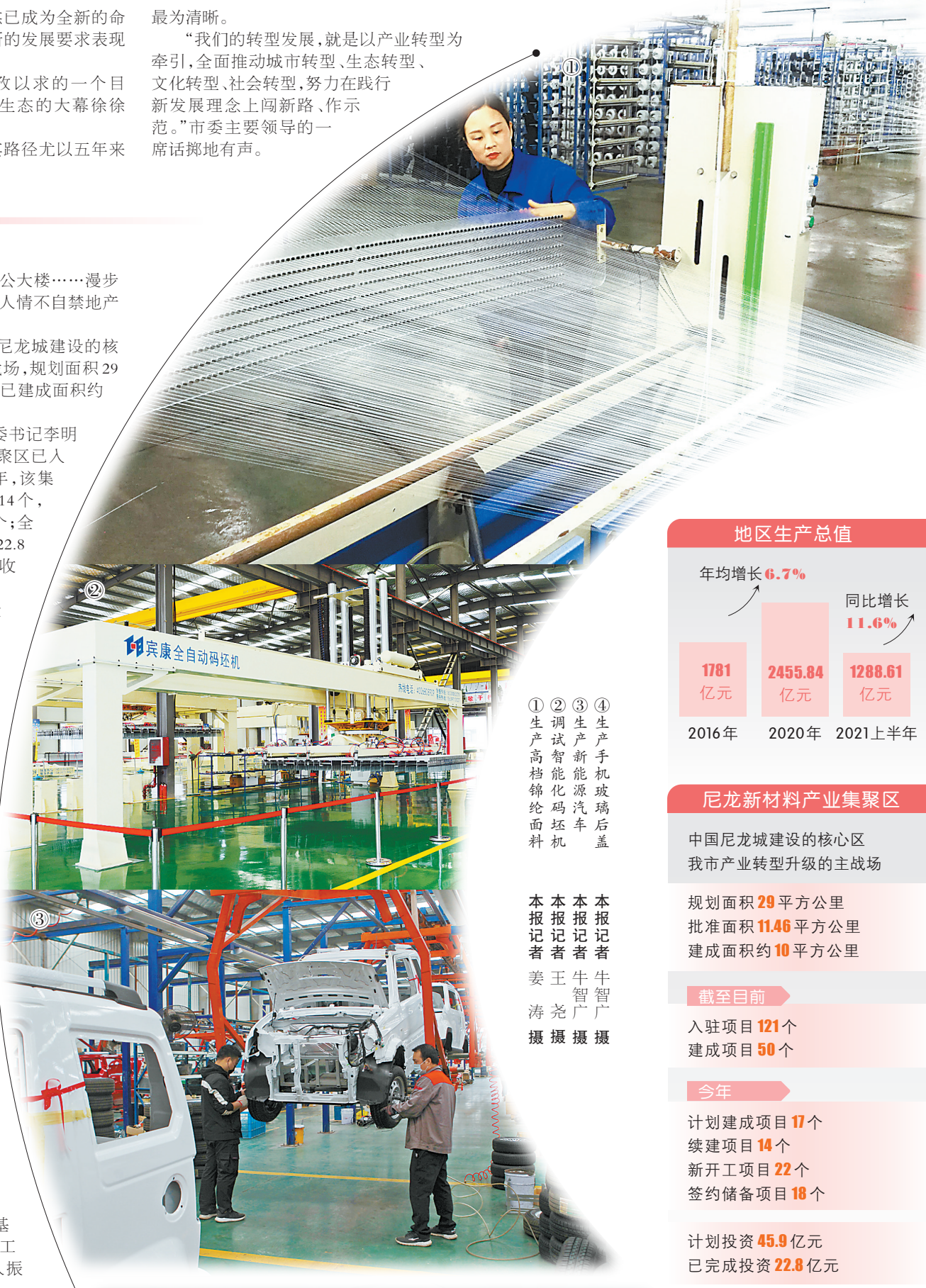
① 生产高档锦纶面料 ② 调试智能化码坯机 ③ 生产新能源汽车后盖 ④ 生产手机玻璃后盖