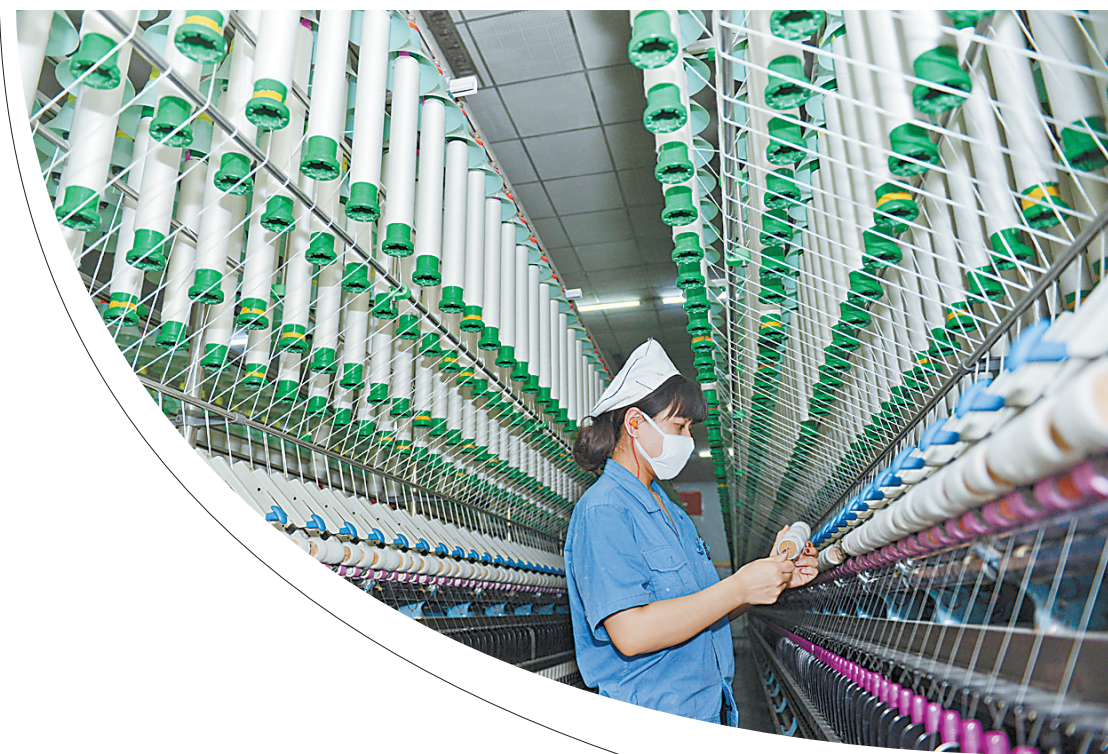
宝丰县宝棉工业园区

升级示范区。2020年，由于我市老工业基地调整改造力度较大，支持传统产业改造、培育新产业新业态新模式、承接产业转移和产业合作等工作成效突出，受到国务院督查激励。 2021年，国家发改委在山西省长治市召开全国产业转型升级示范区现场交流会，我市在会上作典型经验交流发言。 战鼓催征马蹄疾，千帆竞发势如虹。市九次党代会以来的五年，是我市综合实力跃升最明显、转型发展成效最突出的时期之一。“经过不懈努力，鹰城大地面貌发生了前所未有的新变化。”8月27日，市发改委一位负责人在接受记者采访时说。