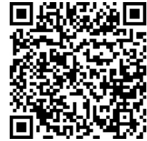
扫描二维码看全文

谋幸福的政党,也是为人类进步事业奋斗的政党。无论国际风云如何变幻,中国共产党始终秉持和平、发展、公平、正义、民主、自由的全球价值观,始终弘扬国际主义精神,始终站在历史正确的一边,站在人类进步的一边,为世界和平发展作出贡献。