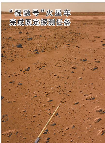
“祝融号”火星车完成既定探测任务

会议还听取了《平顶山市国有企业改革三年行动实施方案》起草、全市经济社会发展责任目标考核评价情况汇报,就做好市十次党代会筹备工作提出了要求。