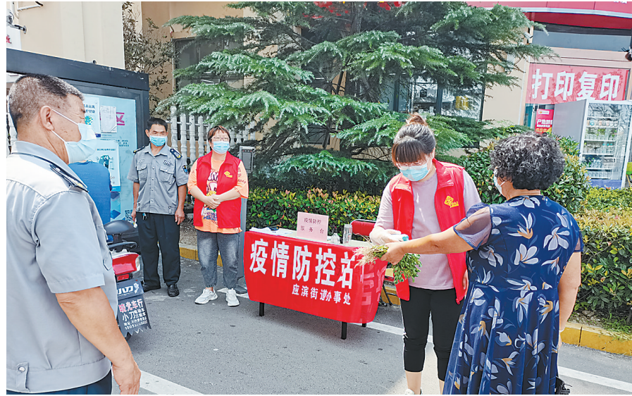
8月2日,应滨街道德馨苑社区加强人员进出管理。图为工作人员为居民进行体温检测。

示范区各镇(街道)坚持“防”字当头,通过加强环境消杀、严格落实各项防控措施,加大监督检查力度等方式,织紧织密疫情防控网。