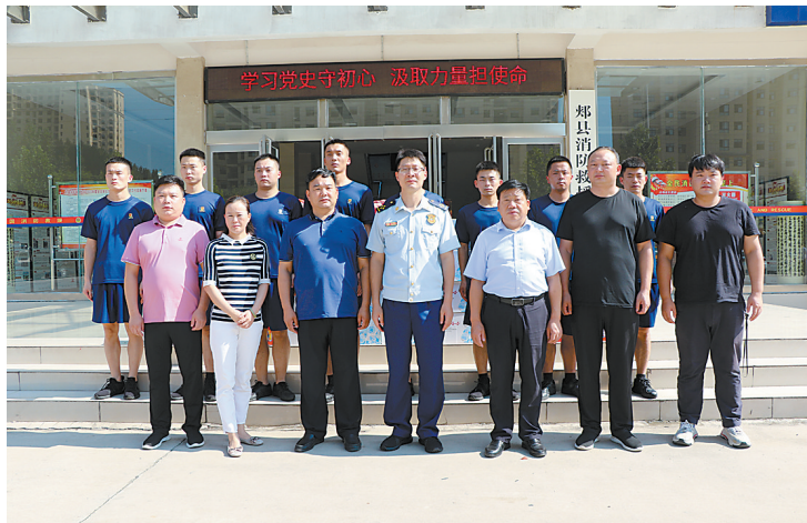
7月29日上午,河南安信达汽车租赁公司负责人一行到郟县应急救援大队送去饮料、纯净水等物品,提前祝消防救援指战员节日快乐。图为该公司职工与消防救援指战员合影留念。