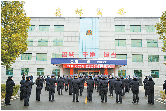
郟县公安局森林公安分局揭牌