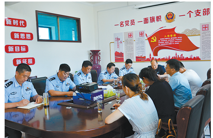
班子成员在进行党史教育学习