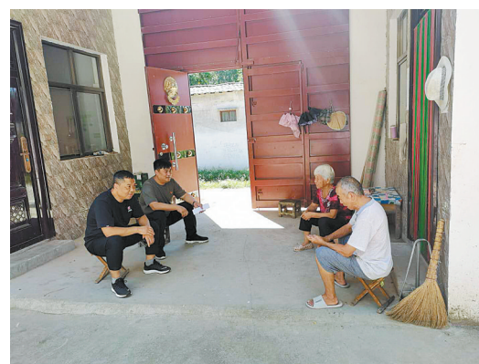
深入农户访民情解民忧