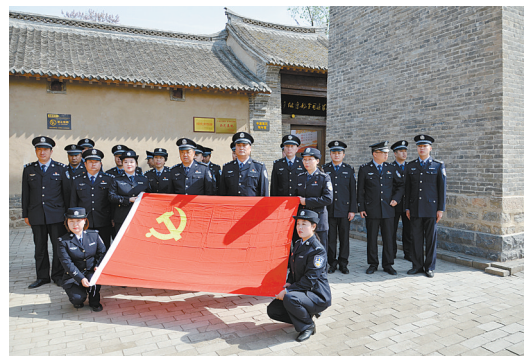
追寻初心红色之旅