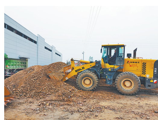
开展砂石治理专项行动