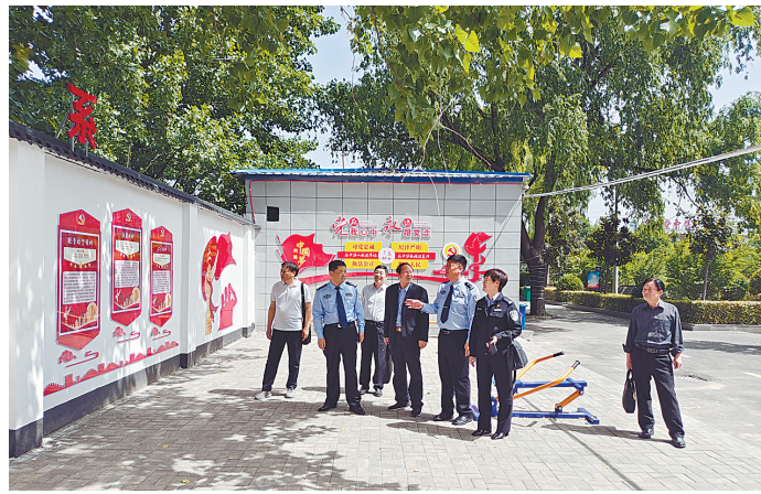
市公安局指导郟县公安局森林公安分局党史文化长廊建设