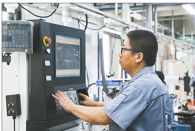
平顶山新晔眼镜有限公司工人利用线切割设备制作模具