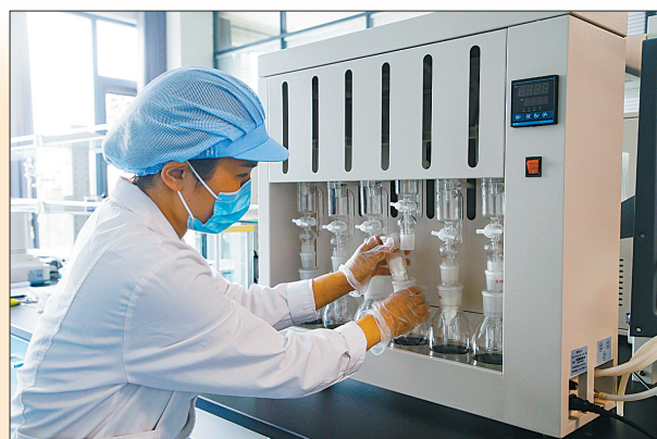
丰佳生物科技有限公司技术人员利用脂肪测定仪对农产品进行检测