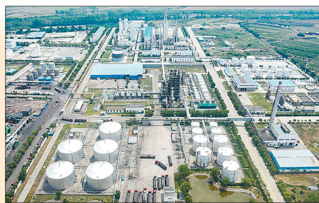
北部煤炭循环经济产业园局部(无人机航拍)