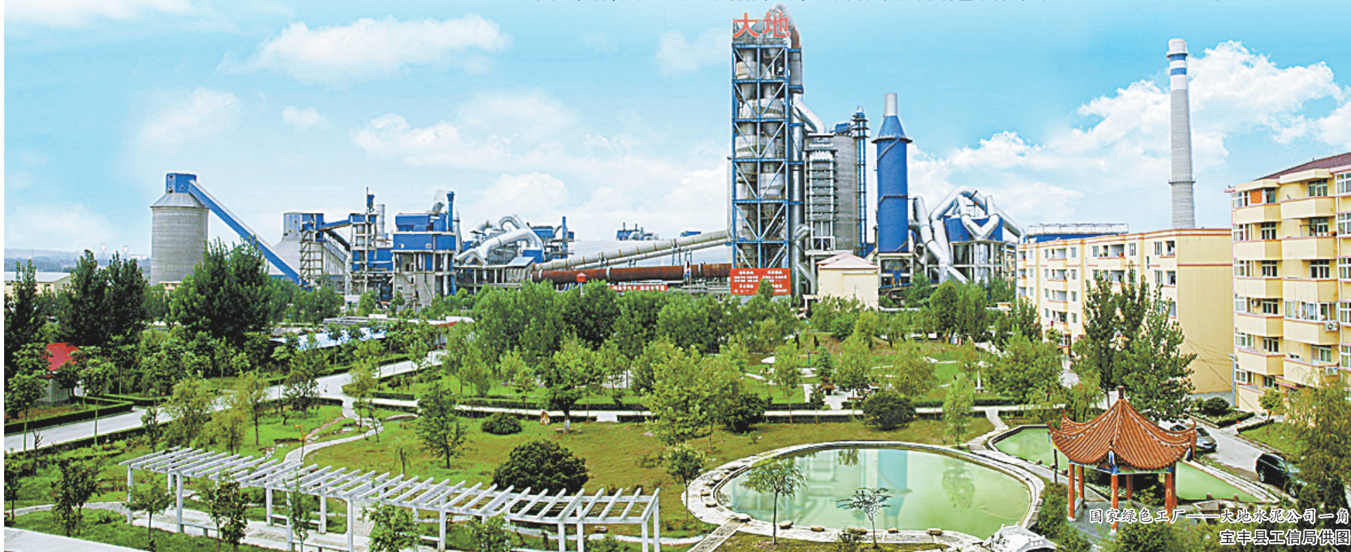
国家绿色工厂——大地水泥公司一角