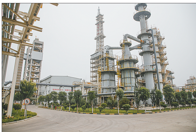
旭阳兴新材料公司厂区