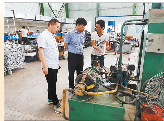
宝丰县工信局工作人员在广源非标公司现场解决问题