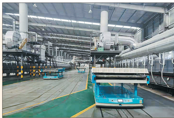
宝丰县圣诺陶瓷有限公司烧成车间内，无人驾驶导引运输车将模具送往布料机进行布料