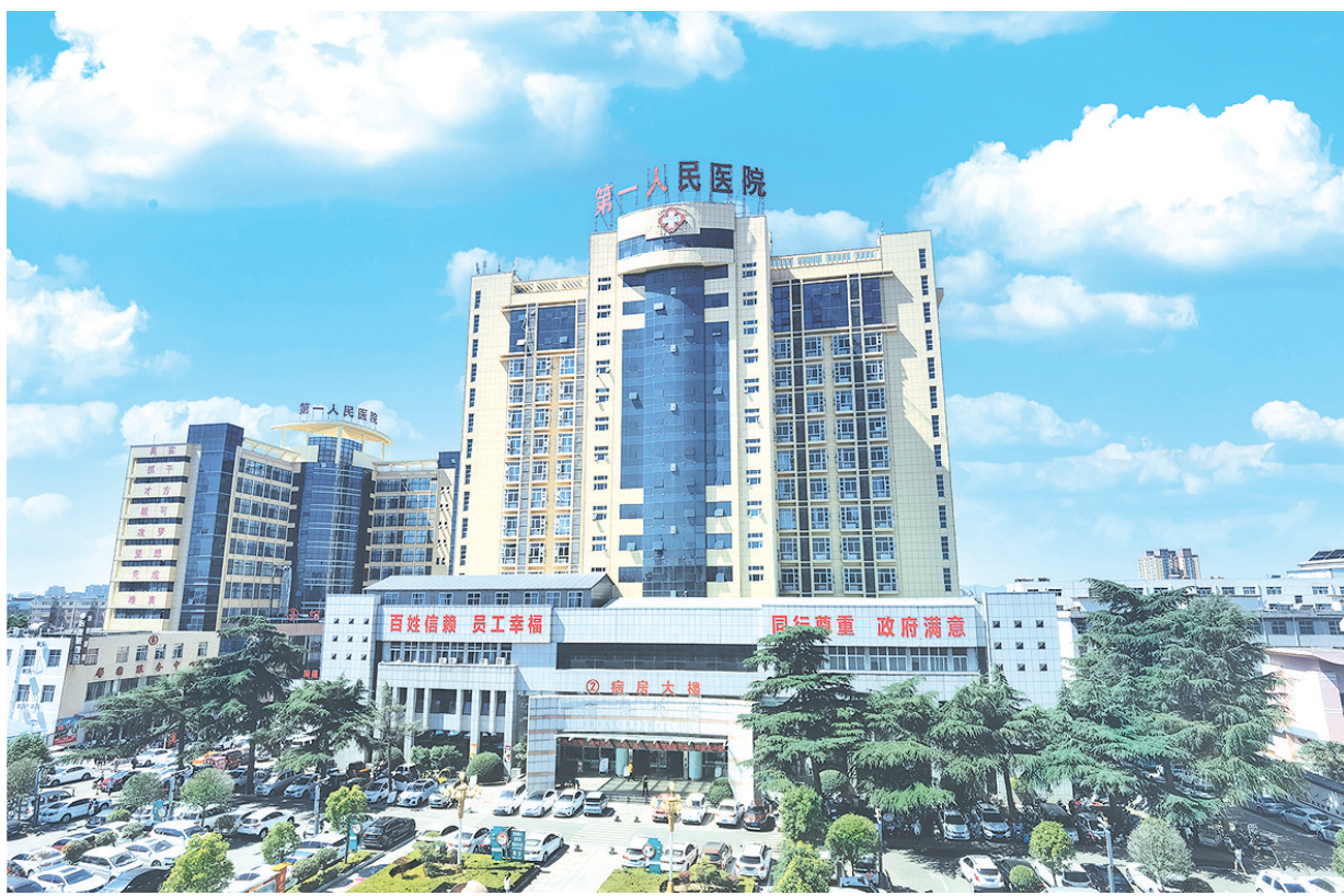
汝州市第一人民医院新貌

汝州市第一人民医院是国家三级综合医院，现有职工1500余人，其中卫生专业技术人员1200余人。医院党委下设4个党总支14个党支部，有党员334名。