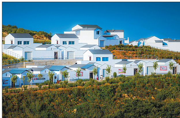
下焦易地扶贫搬迁新村一角