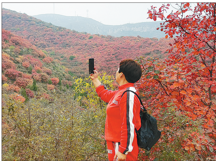
游客在大峪镇山区观赏红叶