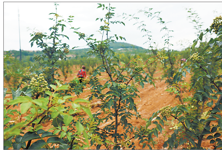
龙王村花椒种植基地