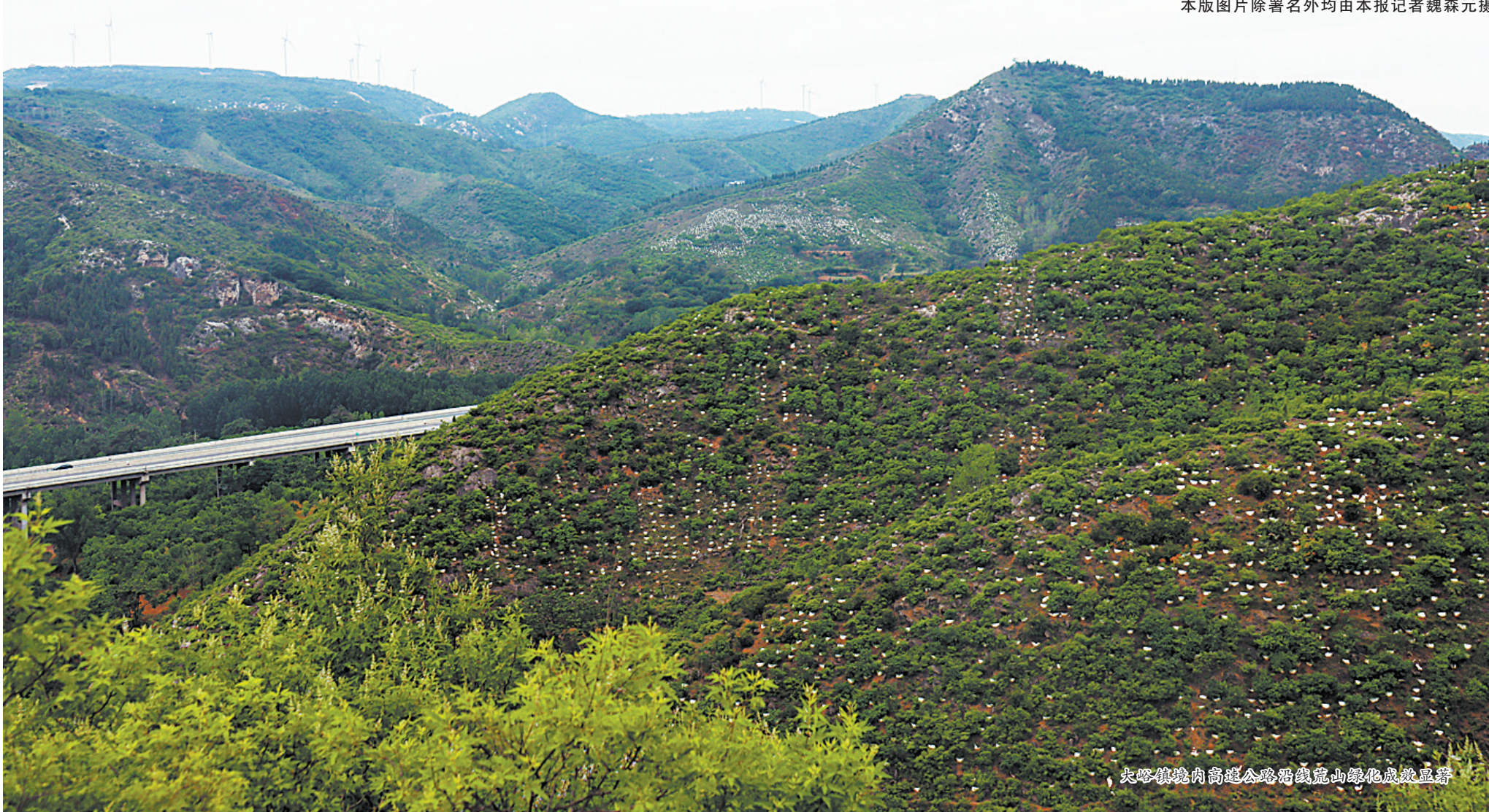
大峪镇境内高速公路沿线荒山绿化成效显著