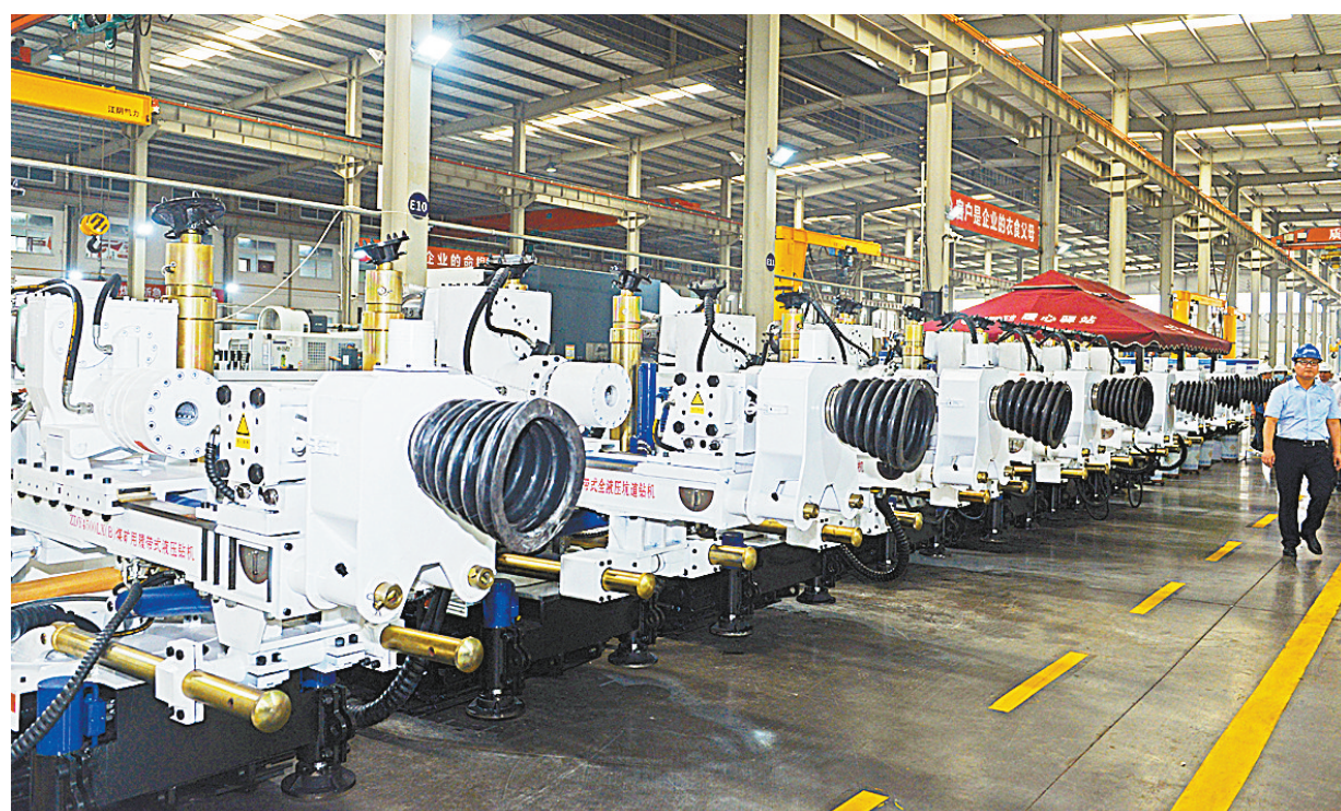
铁福来公司生产的ZDY4500LQW煤矿用履带式全液压坑道钻机入选河南省首台（套）重大技术装备

十四、河南真实生物科技股份有限公司荣获2017年国家专利金奖，研发的我省首个一类新药——阿兹夫定抗艾滋病药，对艾滋病有很好的抑制作用，技术指标处于世界领先地位。