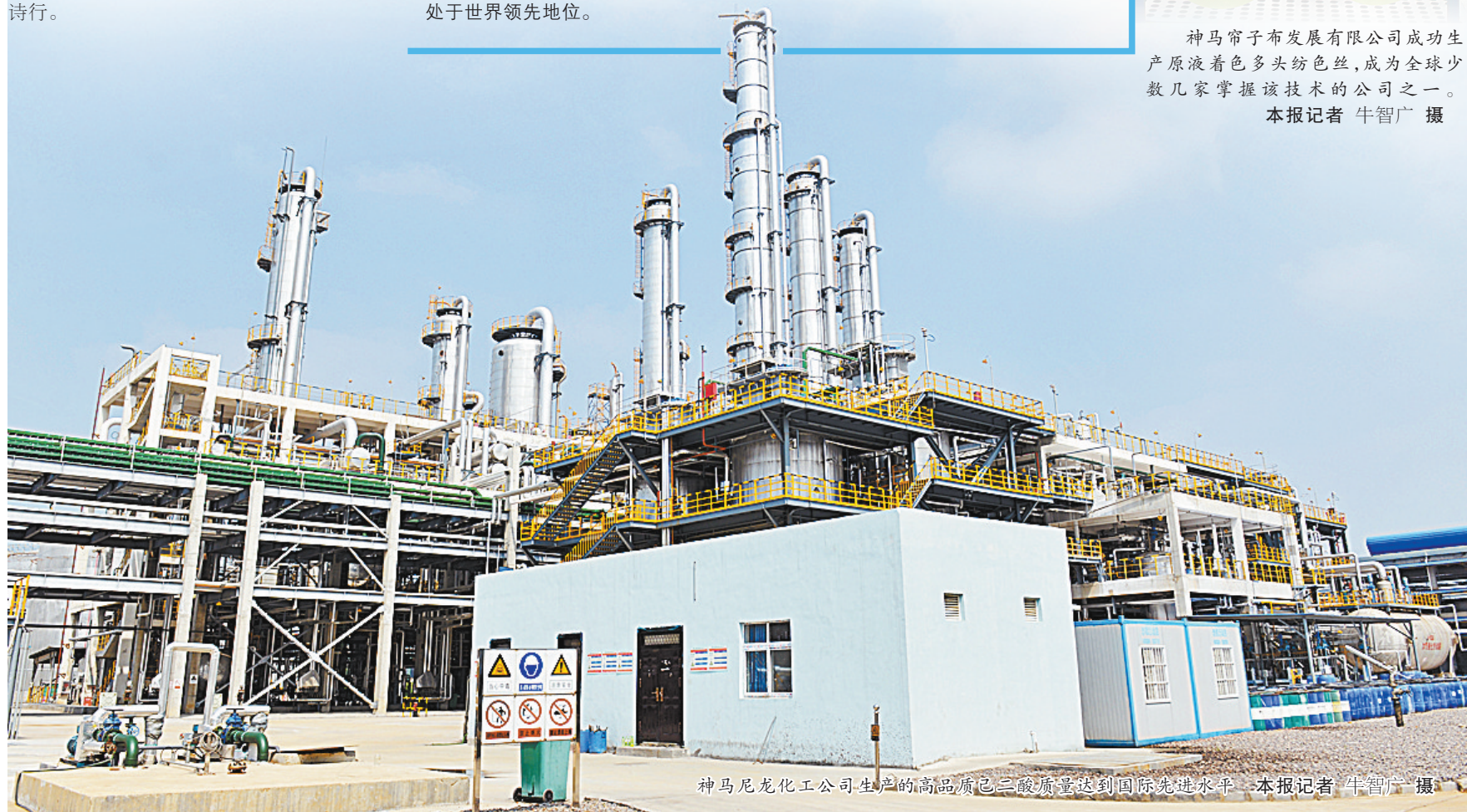
神马尼龙化工公司生产的高品质己二酸质量达到国际先进水平