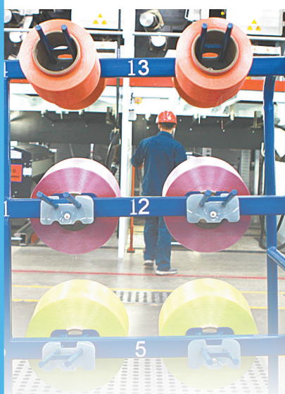
神马帘子布发展有限公司成功生产原液着色多头发色丝，成为全球少数几家掌握该技术的公司之一。