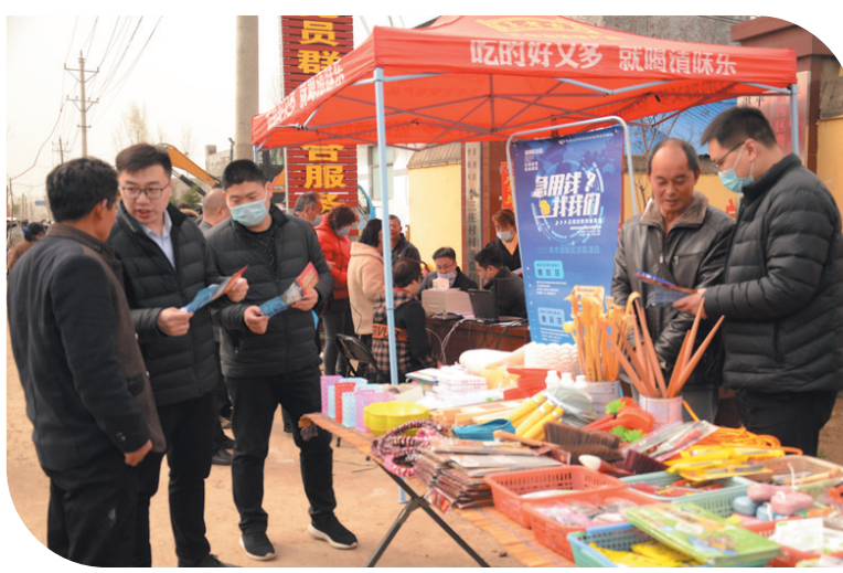
市郊联社工作人员向群众提供贷款咨询服务

自今年3月以来，平顶山市市郊联社深入开展党史学习教育，在“实”字上下功夫，在“落”字上求实效，把有效解决问题、推动业务发展作为衡量标尺，在服务“三农”实践中持续检验党史学习教育成果。