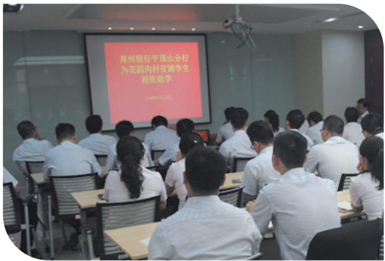
郑州银行平顶山分行为花园沟村贫困学生捐资

郑州银行平顶山分行认真履行从严治党主体责任，贯彻落实上级党委、政府各项决策部署和高质量发展战略，以抓党建为引擎促经营发展、强内部管理，推进党建与业务融合，在发展中迸发新活力。