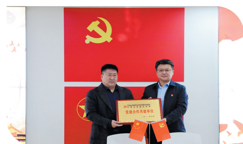
新华区农信联社与市蓝天学校互授“党建合作共建单位”牌匾

在改革发展进程中，新华区农信联社不断增强“四个意识”、坚定“四个自信”、做到“两个维护”，以党建引领业务发展，实现党建与业务发展的“同频共振”。截至4月底，该联社各项存款余额99.11亿元，较年初增加10.49亿元；各项贷款余额75.66亿元，较年初增加3.04亿元。