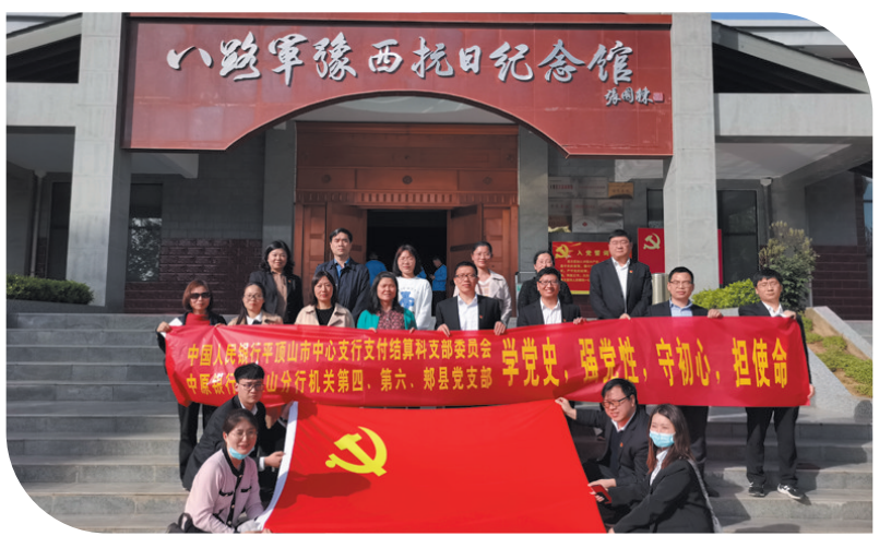
开展“学党史、强党性、守初心、担使命”党史学习联学联建活动

近年来，中原银行平顶山分行以坚持党的领导为准则，以强化风险防控为导向，主动承担社会责任，助力我市基础设施和城镇化建设，全力支持地方经济发展。