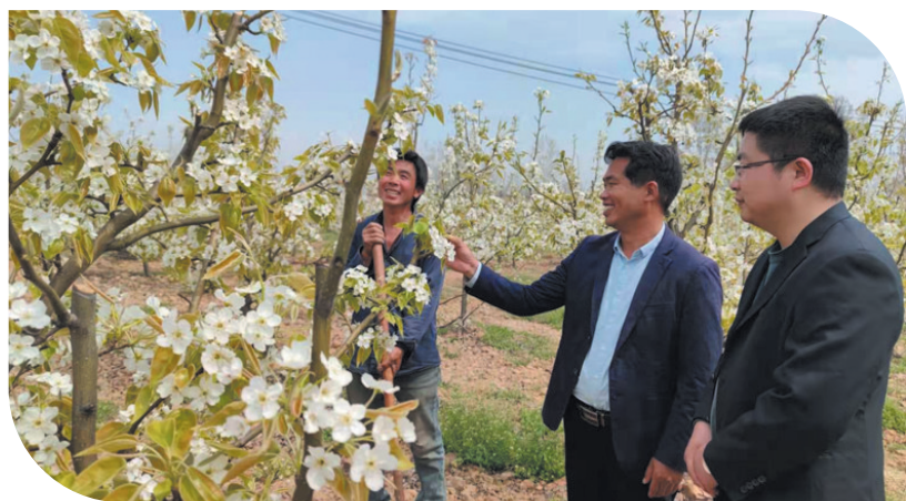
鲁山县董周乡种植户向邮储银行平顶山分行工作人员交流

今年以来，邮储银行平顶山分行深度聚焦国家重点工作，持续做好巩固脱贫攻坚成果同乡村振兴的有效衔接，为建党100周年献礼。截至4月底，该行扶贫小额贷款余额7715.29万元，较去年同期增长3690.07万元；累计投放扶贫小额贷款5736笔2.23亿元，带动贫困人口12646人；涉农贷款余额36.41亿元，在金融支农方面发挥了国有大行的担当和作为。