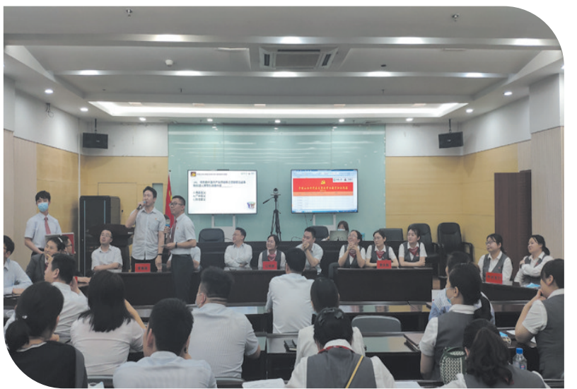
广发银行平顶山分行党总支举办党史学习教育知识竞赛

广发银行平顶山分行坚持以习近平新时代中国特色社会主义思想为指导，以党建为统领，以业务发展为抓手，以合规内控、服务提升为保障，全力支持平顶山市经济发展。