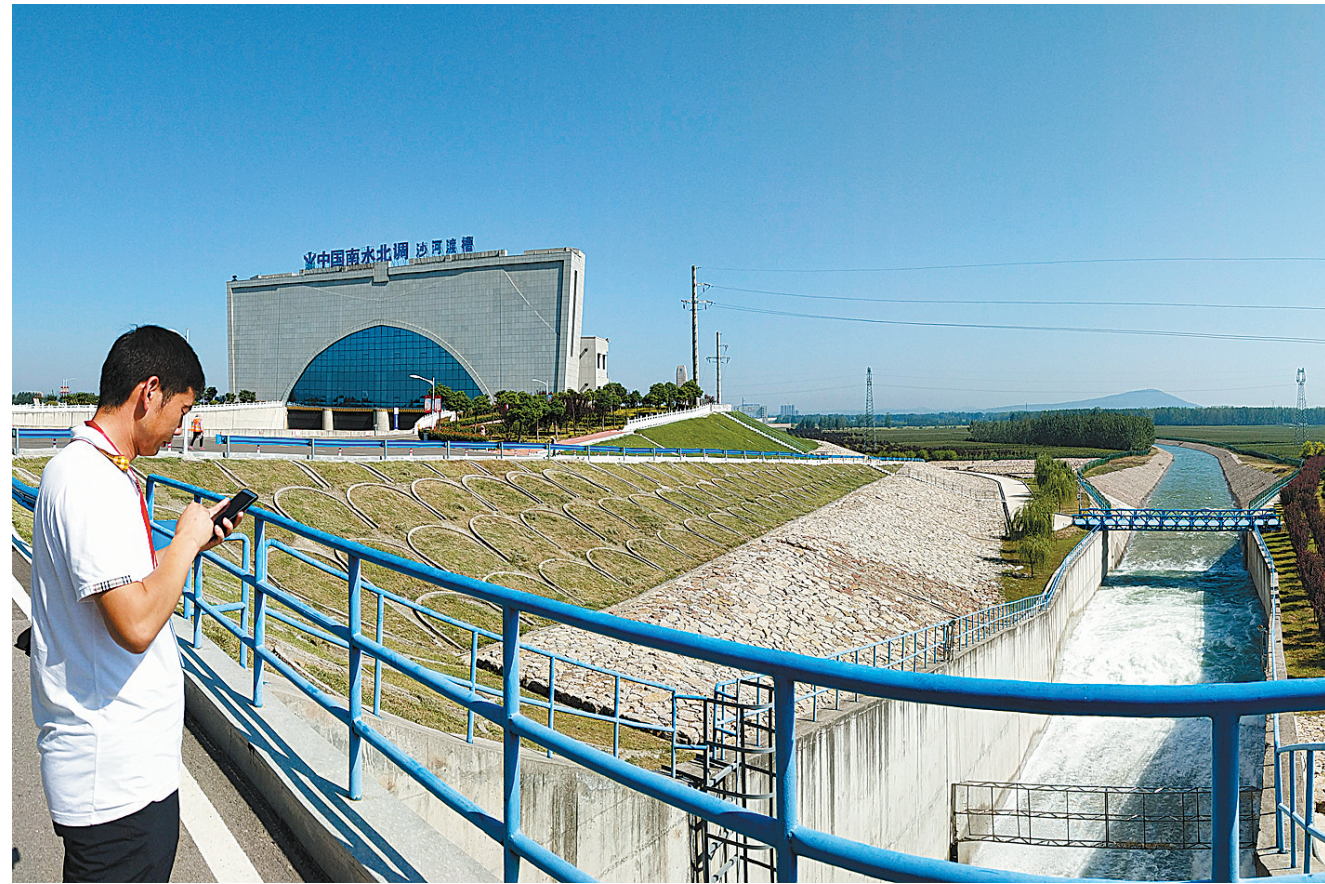
去年八月十九日上午，一渠清水从南水北调沙河渡槽旁的沙河退水闸喷涌而出，流向沙河。据南水北调中线工程鲁山管理处负责人介绍，当月南水北调向我市沙河段补水三千万立方米。

在各级干部的艰苦努力和群众的积极支持下，我市南水北调中线工程永久性、临时性用地征迁工作均提前完成。2011年2