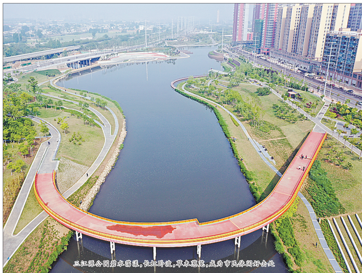
三江公园碧水潺潺,长虹卧波,草木葱茏,成为市民休闲好去处

2020年,市住建局重点谋划推动矿工路东延、科技路北延、华耀城经八路经九路、市区27个道路交叉口优化改造等项目;成立了市政项目建设前期工作专班,按照轻重缓急原则,将15个新建项目分ABC三类逐一报批实施。2020年8月,湛河老城区段提升改造工程完工并向市民开放。培英路改造、园林路西延、卫东区经一路、湛河南路改造、湛南规划七路等9项工程基本完工。