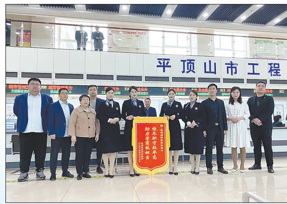
市住建局简化流程,加班加点高效办理施工许可证,4月22日,企业代表送来锦旗表示感谢