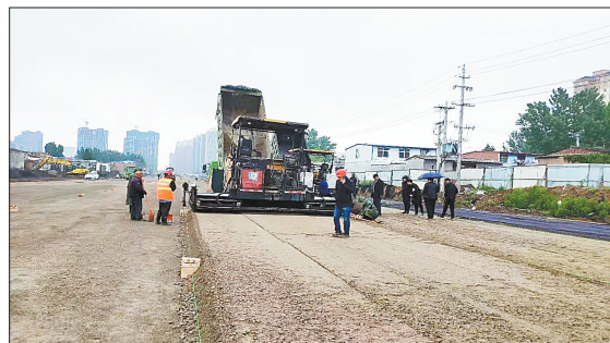
正在紧张施工的东环路南延工程,建成后将改善区域环境,方便居民出行