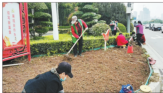
市园林绿化中心员工在市区建设路路段绿化带补栽苗木