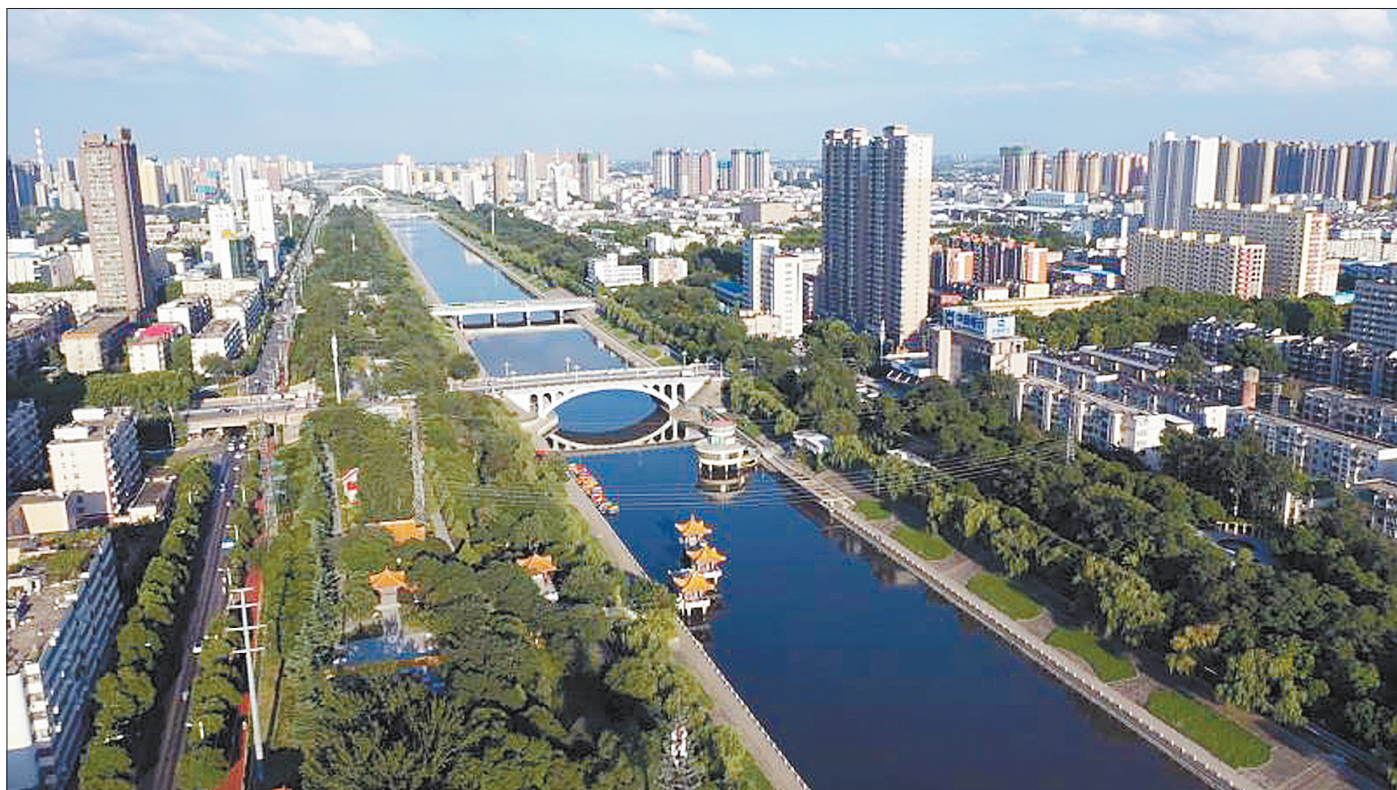
风景秀丽的湛河公园