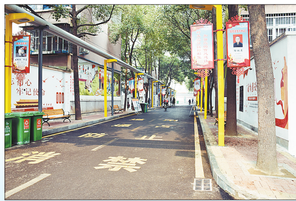
市区曙光街15号院为老旧小区,改造后旧貌换新颜