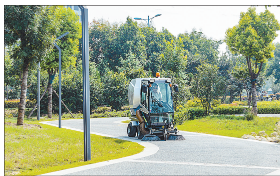
工作人员驾驶新能源扫车在市区建设路路段清扫游园道路