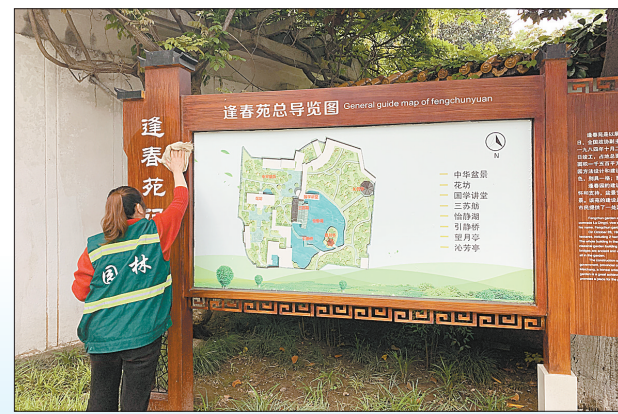
市园林绿化中心员工在擦拭逢春苑导览图