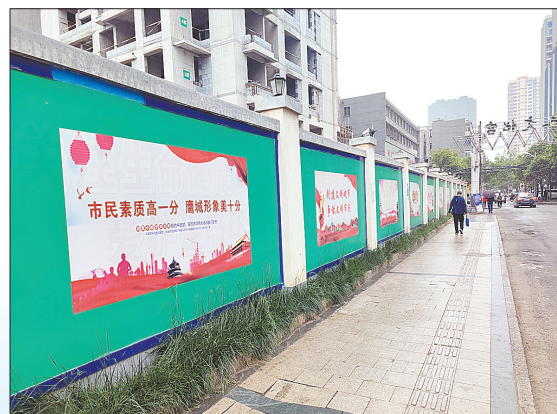
市区高标准设立的建筑工地施工围挡