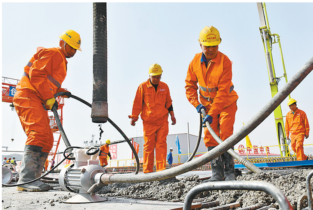
潍烟高铁烟台段开始箱梁浇筑作业

3月24日,在潍(烟)烟(台)高铁福山制梁场,中铁上海局的工人进行箱梁浇筑作业。潍烟高铁对补齐胶东半岛地区高速铁路发展短板、推动胶东经济圈一体化具有重要意义。