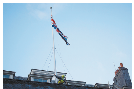
2月2日,英国伦敦的唐宁街10号首相府降半旗致哀。

新华社德黑兰2月2日电(记者夏晨)据伊朗伊斯兰共和国通讯社2日报道,伊朗常驻维也纳联合国和其他国际组织代表加里巴巴迪当天宣布,伊方新近在纳坦兹核设施成功安装了数百台IR-2m型离心机,以提升铀浓缩能力。