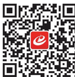
“中共河南省委办公厅互联网+督查”微信公众号二维码

2月2日,意大利总统马塔雷拉在罗马对媒体讲话。意大利总统马塔雷拉2日晚间宣布,由于众议长菲科组建议会多数派政府的尝试未能成功,他将尽快授权一名高级别人士组建新政府,以应对各项当务之急。