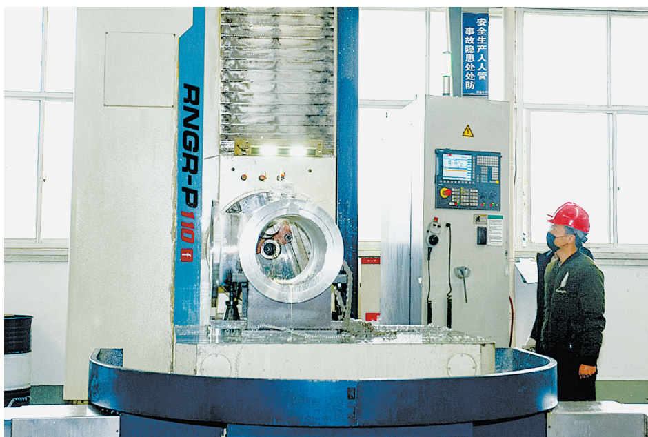
发展高新技术产业

的工作流程,从严从细落实各项防控措施,抓好入市第一道关口。要健全完善应急响应机制,做到指令清晰、系统有序、条块畅通、执行有力,确保对突发疫情和可能发生的疫情及时反应、快速处置、精准管控、有效救治。要抓好重点场所管控,严格重点人群管理,严防人员聚集流动风险。要压紧压实地方、部门、单位、个人“四方责任”,切实加强组织领导,强化督导检查,加大宣传引导力度,确保做到守土有责、守土负责、守土尽责。 会议还对抓好当前经济运行、安全稳定、廉政建设、民生保障等工作进行了部署。