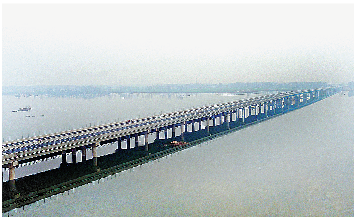
2020年12月26日,位于鲁山县辛集乡徐营村的大西环沙河特大桥建成通车。该桥总长1569米,是我市大西环项目的关键控制性工程(资料图片)。