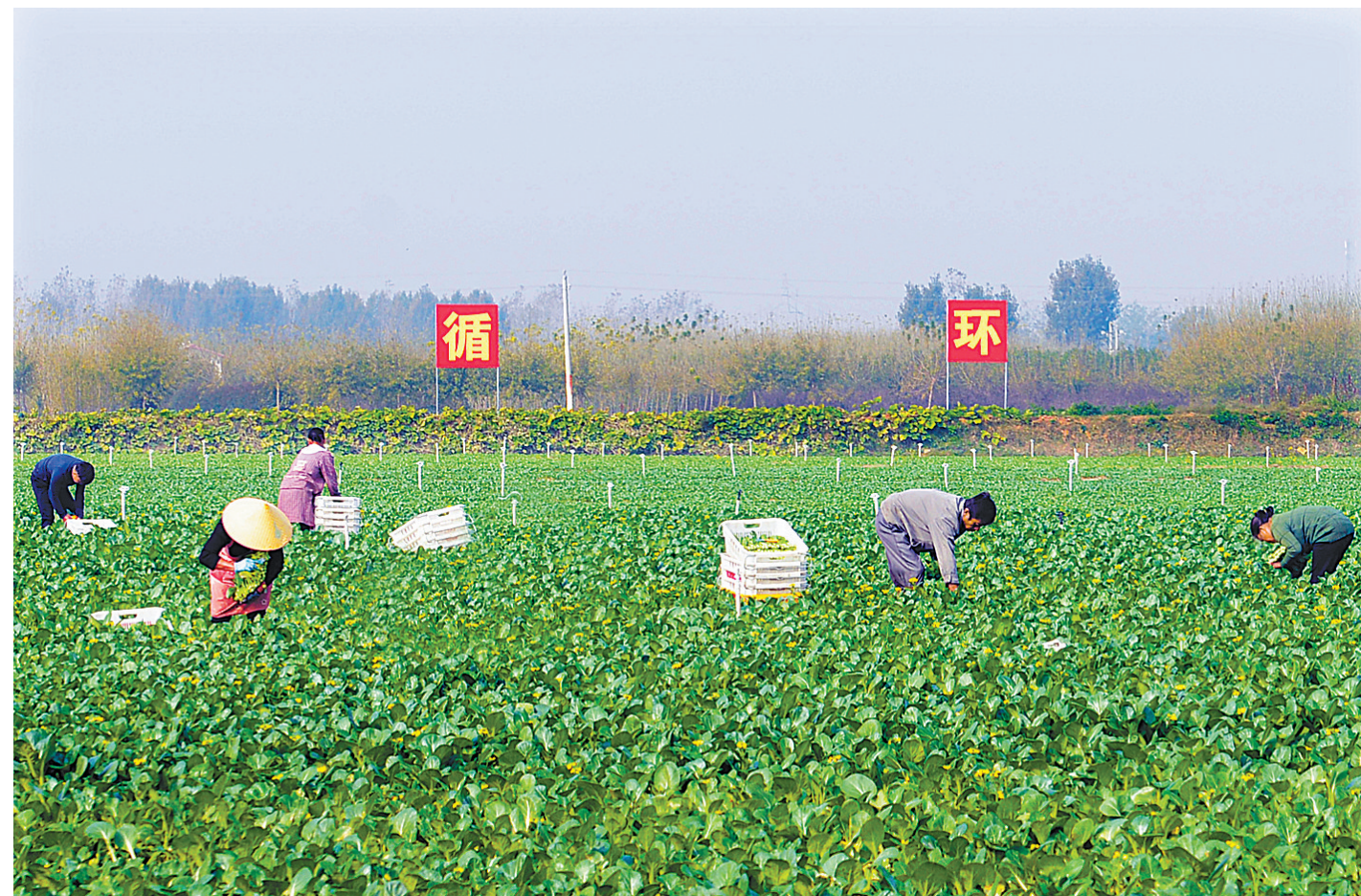
村民在位于鲁山县马楼乡贾集村附近的天健农业有限公司生态农业产业园采收广东菜心(资料图片)

5年来,我市大力实施品牌发展战略。目前,全市有效期内的“三品一标”产品总数达131个(不包含生产资料),其中绿色食品78个,农产品地理标志9个,绿色食品生产资料6个,有机食品生产资料4个,“三品一标”总产量139.3万吨。2020年新申报创建“三品一标”示范基地2个,全部通过专家组检查验收,全市“三品一标”示范基地总