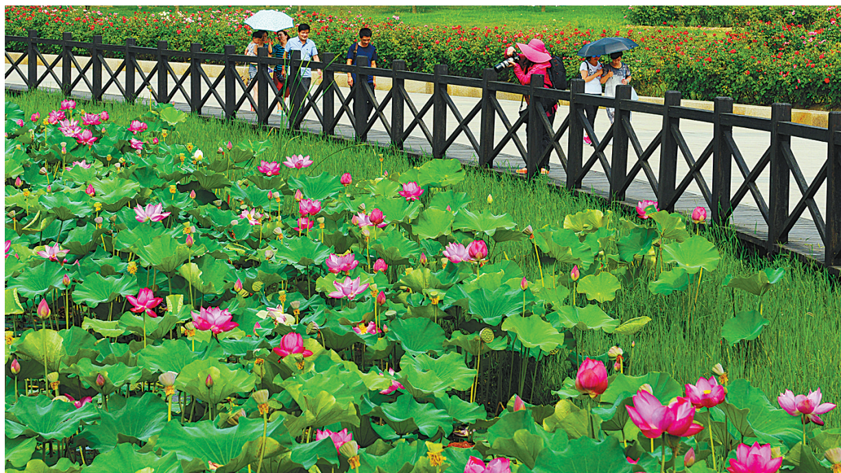
游人在白龟湖国家湿地公园观赏荷花(资料图片)。去年底,省旅游发展委员会发布《白龟湖国家湿地公园成为我市市辖区范围内第一家国家5A级旅游景区》。