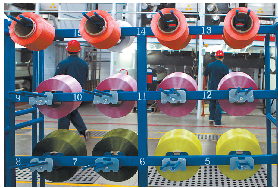
4000t/a尼龙66差异化工业丝项目位于平顶山尼龙新材料产业集聚区,由神马帘子布发展公司投资建设,是平煤神马集团进一步推进国企改革、优化产业结构而建设的尼龙骨干项目之一,采用国内领先水平的大