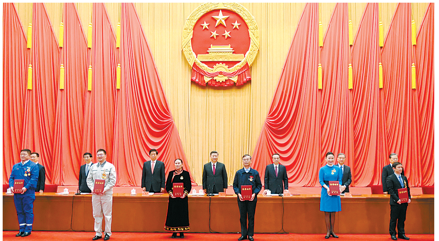
11月24日,全国劳动模范和先进工作者表彰大会在北京人民大会堂隆重举行。这是习近平等党和国家领导人向全国劳动模范和先进工作者代表颁发荣誉证书。

新华社北京11月24日电 全国劳动模范和先进工作者表彰大会24日上午在北京人民大会堂隆重举行。中共中央总书记、国家主席、中央军委主席习近平出席大会并发表重要讲话,代表党中央、国务院,向受到表彰的全国劳动模范和