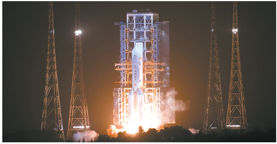
从“奔月”到“揽月” 嫦娥五号成功发射

2020年11月25日 星期三 庚子年十月十一日 中共平顶山市委机关报 平顶山日报传媒集团出版 国内统一连续出版物号 CN41-0005 第12508期 新闻热线 4944764 网址: http://www.pdsxww.com 今日8版