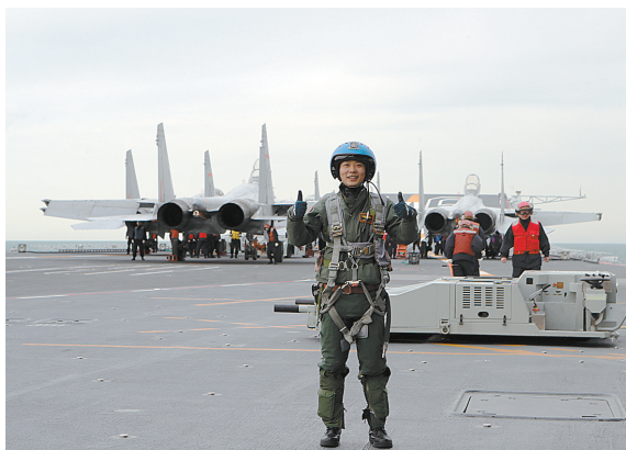
飞行学员成功着舰后,向舰面官兵竖起大拇指致敬(资料照片)

调整姿态、放下尾钩、对正跑道……随着最后一架歼-15舰载战斗机降落在辽宁舰甲板上,海军首批从高中招收的飞行学员顺利通过昼间航母资质认证,成为舰载战斗机飞行员。