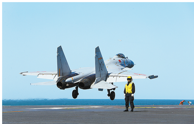
飞行学员驾驶歼-15舰载战斗机在辽宁舰进行触舰复飞训练(资料照片)