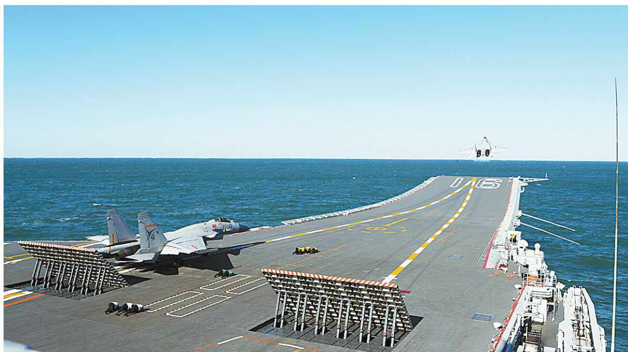
飞行学员驾驶歼-15舰载战斗机在辽宁舰滑跃起飞(资料照片)