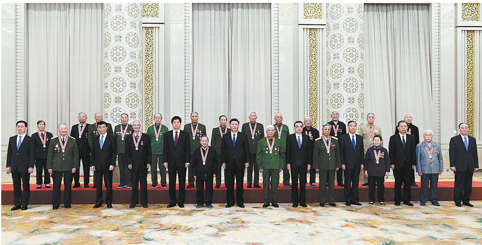
10月23日，纪念中国人民志愿军抗美援朝出国作战70周年大会在北京人民大会堂隆重举行。会前，习近平等领导同志会见“中国人民志愿军抗美援朝出国作战70周年”纪念章获得者代表，并同大家合影留念。

新华社北京10月23日电 纪念中国人民志愿军抗美援朝出国作战70周年大会23日上午在北京人民大会堂隆重举行。中共中央总书记、国家主席、中央军委主席习近平在会上发表重要讲话强调，伟大的抗美援朝战争，抵御了帝国主义侵略扩张，捍卫了新中国安全，保卫了中国人民和平生活，稳定了朝鲜半岛局势，维护了亚洲和世界和平。回望70年前伟大的抗美援朝战争，进行具有许多新的历史特点的伟大斗争，瞻望中华民族伟大复兴的光明前景，我们无比坚定、无比自信。我们要铭记抗美援朝战争的艰辛历程和伟大胜利，弘扬伟大抗美援朝精神，雄赳赳、气昂昂，向着全面建设社会主义现代化国家新征程，向着实现中华民族伟大复兴的中国梦继续奋勇前进。