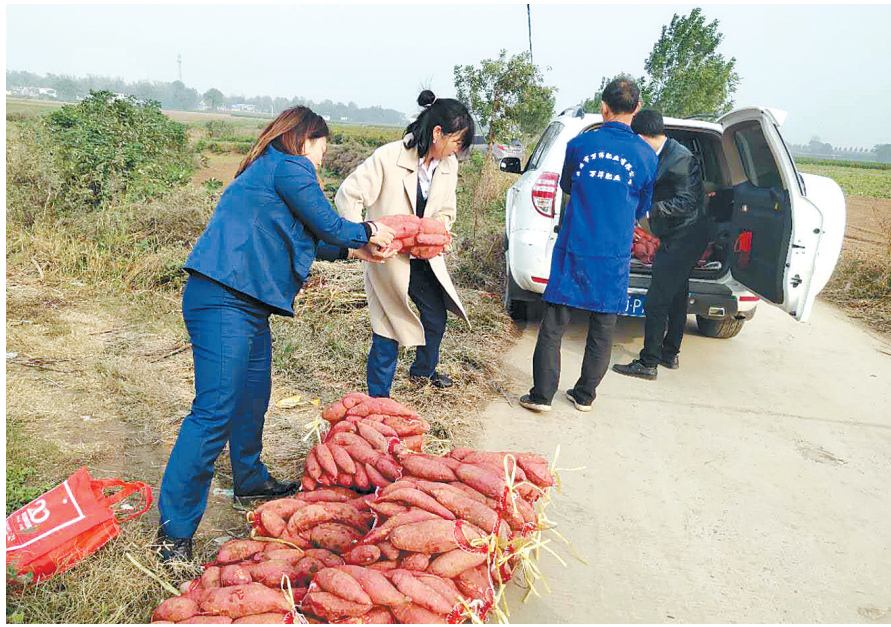
10月16日,中信保诚人寿平顶山中支员工在鲁山县熊背乡房村开展消费扶贫活动。

本报讯(记者焦葵葵)今年10月17日是第七个国家扶贫日。为贯彻落实监管机构及总公司关于扶贫工作的指导