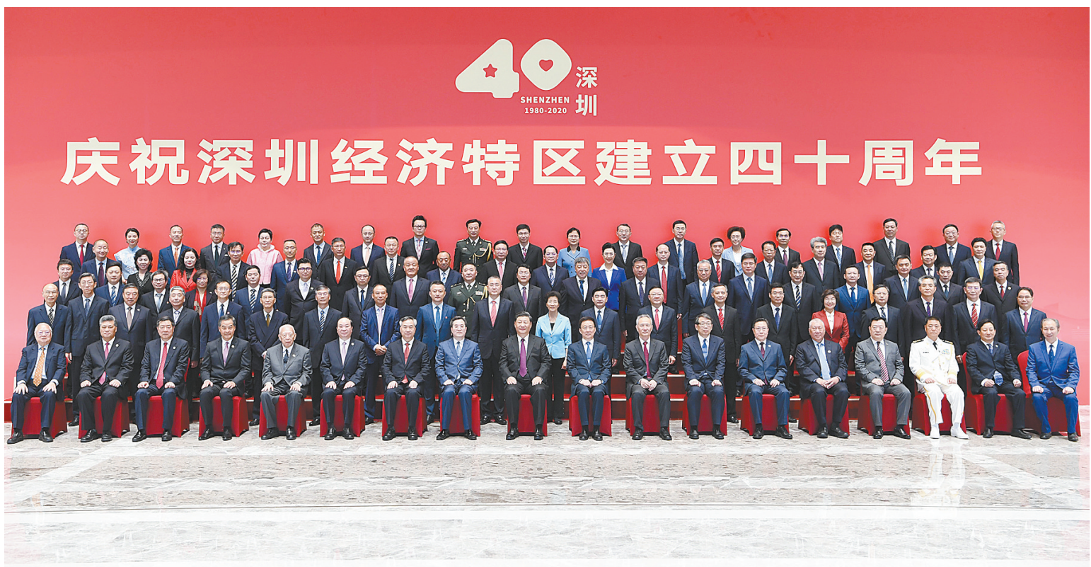
10月14日,深圳经济特区建立40周年庆祝大会在广东省深圳市隆重举行。中共中央总书记、国家主席、中央军委主席习近平在会上发表重要讲话。这是习近平等亲切会见参加庆祝大会的部分代表并同大家合影留念。

新华社深圳10月14日电 深圳经济特区建立40周年庆祝大会14日上午在广东省深圳市隆重举行。中共中央总书记、国家主席、中央军委主席习近平在会上发表重要讲话强调,要高举中国特色社会主义伟大旗帜,统筹推进“五位一体”总体布局,协调推进“四个全面”战略布局,从我国进入新发展阶段大局出发,落实新发展理念,紧扣推动高质量发展、构建新发展格局,以一往无前的奋斗姿态、风雨无阻的精神状态,改革不停顿,开放不止步,在更高起点上推进改革开放,推动经济特区工作开创新局面,为全面建设社会主义现代化国家、