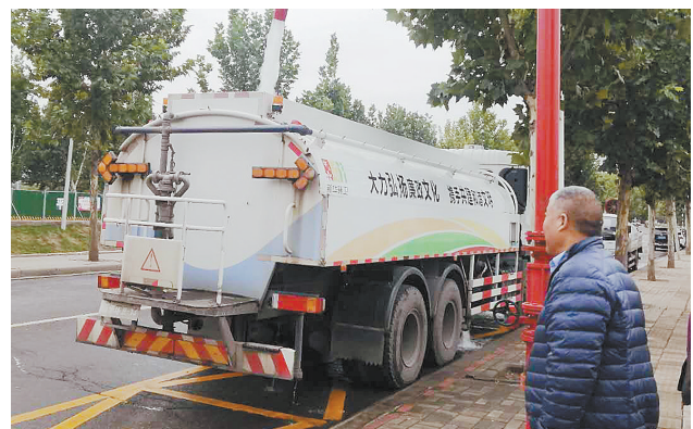
环卫洒水用上中水

力选煤厂。2016年前,选煤厂每年使用中水约35万吨。2016年,一矿投资69万元对选煤厂进行生产用水闭路循环技术改造,实现了选煤废水充分循环使用,改造后每年可减少中水用量15万余吨,有效降低了补充水量。另外,一矿还先后投入50余万元,在公共用水区域安装节水型器具1616个,节水型设施普及率达到96%。由于节水效率突出,一矿先后获得2018年市级“节水型企业”、2019年省级“节水型企业”、2020年市“节约用水宣传先进工作单位”荣誉称号。