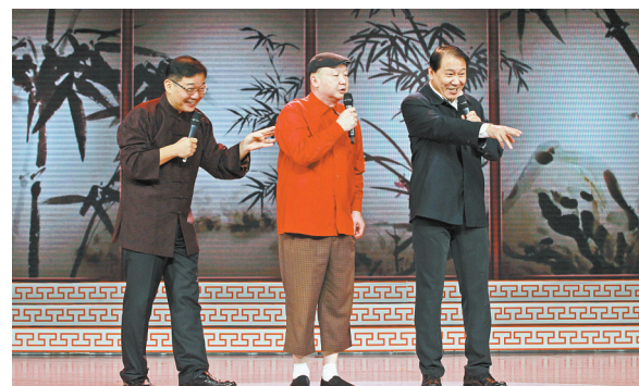
大兵和搭档表演相声《向领导汇报》