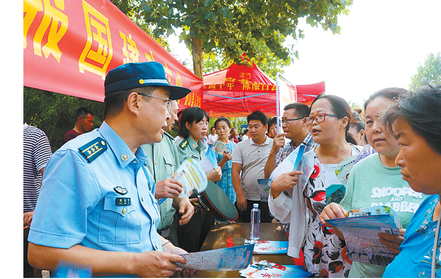
征兵咨询台前围满了家长

此次宣传活动共发放宣传彩页2000余份,提供咨询800多人次。下一步,该县人武部计划利用考生回校报考等有利时机继续宣传,不断提高大学生入伍率,为部队输送优质兵员。