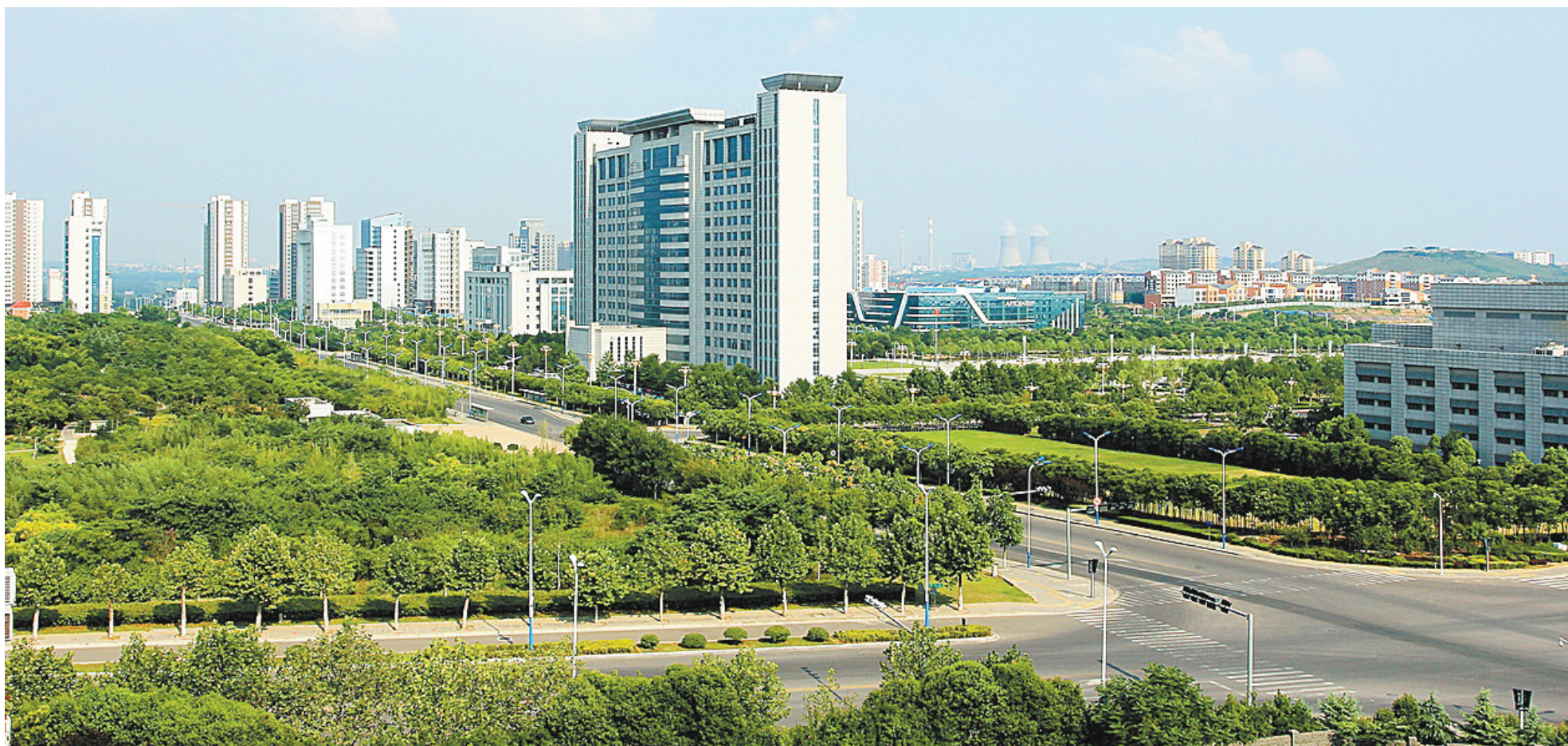
平顶山投资环境越来越好

越来越好的投资环境，也吸引了众多优质企业来到鹰城投资兴业，助力鹰城跨越式发展、综合实力高质量重返河南省第一方阵。