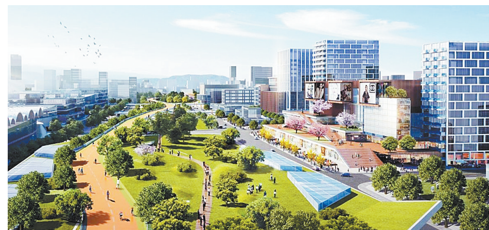
东方生态智慧城效果图

该项目立足打造“五园一馆一中心”，包含智慧城市展览馆、东方生态智慧城接待中心及五大公园（都市水岸公园、创智活水公园、活力运动公园、艺术创新公园、生态森林公园）体系。景观绿化、水系工程依托白鹤洲国家城市湿地公园现状水系，对区域内整体进行土壤修复、水系连通、植被恢复，以水脉拓展周边绿化空间，修复及提升滨河生态功能，在生态修复的基础上打造市民休闲、游憩空间，营造绿色、活水公园系统，全面改善生态环境，建设城市氧吧。打造“1+1+3”公共中心体系，即1个15分钟生活圈服务中心、1个10分钟生活圈服务中心及3个5分钟生活圈服务中心，各