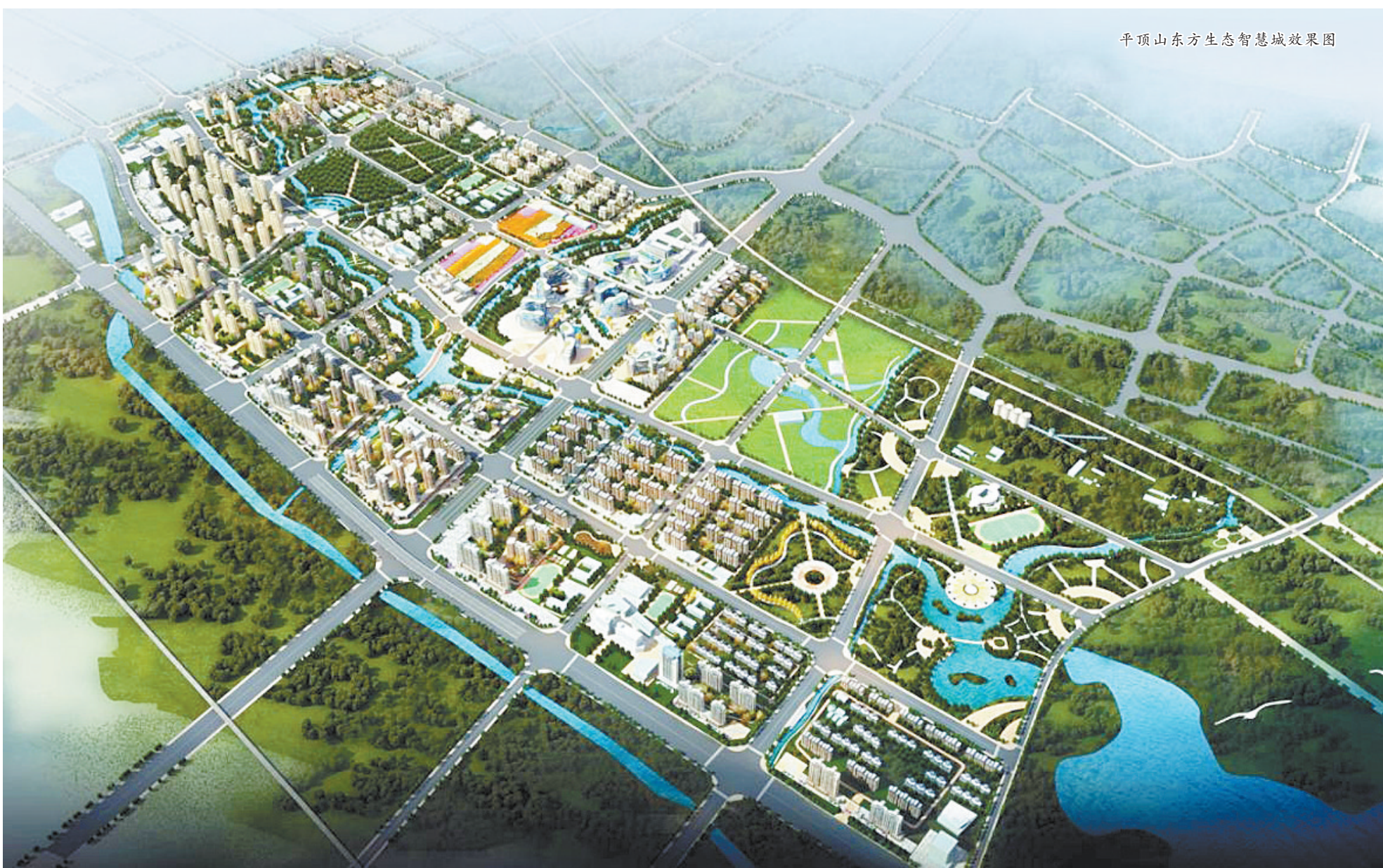
平顶山东方生态智慧城效果图