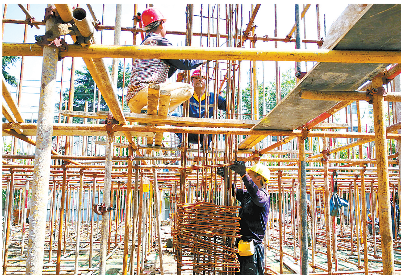
建设智慧康养机构

本报讯 (记者田秀忠 通讯员胡瑞霞)7月16日晚,延迟4个月的央视3·15晚会播出,节目中曝光了南昌“汉堡王”门店存在偷工减料和使用过期食材等问题。为确保群众饮食安全,新华区市场监管局连日来对辖区加工汉堡的快餐单位开展了专项检查。 自7月17日起,新华区市场监管局执法人员先后到辖区肯德基、麦当劳、德克士、必胜客、华莱士及其他加工汉堡的快餐单位进行突击检查。在检查过程中,执法人员根据门店的进货查验记录,重点查验了门店所有食材的标签、标识,察看有效期和是否有涂改情况等,察看冷藏冷冻食品是否按照温度要求储存;检查设施设备和工具管理、清洗消毒、加工制作过程控制等情况。对现场发现的操作间物品摆放杂乱、清洗消毒记录不完善等问题,责令其立即整改。 目前,新华区辖区没有“汉堡王”门店,现有肯德基、麦当劳、华莱士、德克士、必胜客等西式快餐连锁企业或独立门店26家。新华区市场监管局局长刘军伟表示,下一步,该局将结合实际,通过风险隐患排查、拉网式检查和提醒约谈等方式,回应社会关切,切实保障人民群众的食品安全和身体健康。