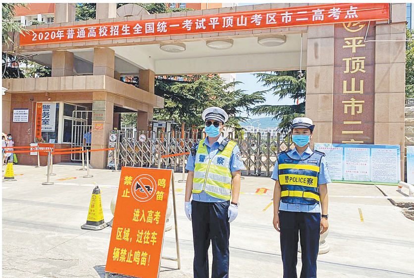
7月7日,市公安局矿路派出所交警巡防大队民警在市二高考点门外设立禁鸣警示牌,努力为考生营造安静的应试环境。

噪声给城市环境带来不良后果,不利于人们的身心健康。中高考期间,噪声污染需要治理,中高考之后依旧需要,让噪声治理从考试季走向常态化。