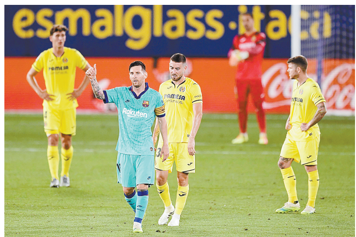
7月5日，巴塞罗那队球员梅西（左二）进球后庆祝，但随后这粒进球因越位在先被判无效。