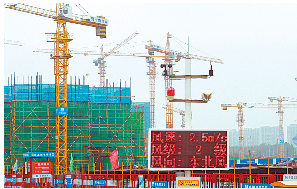
加紧建设不忘大气污染防治

7月1日，施工人员在加紧建设高新区戴庄棚户区改造项目。 该项目裸露的施工土地都种有草坪，草坪上还装有喷雾装置，监测系统随时监测施工工地各项空气指标。