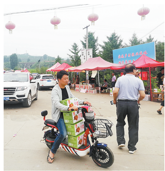
果农往附近的大车上送货

6月20日上午，鲁山县熊背乡大年沟村举办首届血桃采摘节，吸引了众多游客采摘、购买。当天，大年沟村销售血桃40多吨，其中电商渠道销售约10吨。 大年沟村原来是典型的深山贫困村。近年来，在党的扶贫政策支持下，该村依靠地理优势，大力发展血桃种植产业。目前，全村90%以上的农户种植血桃，血桃种植面积3600亩。靠种植血桃，大年沟村摘掉了贫困村的帽子。2017年，大年沟血桃获国家农产品地理标志认证，2018年获原省农业厅无公害产品认证。大年沟村被原国家农业部授予“全国一村一品示范村”称号。大年沟血桃成了市场热捧的“网红”产品。