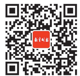
教育时报微信公众号