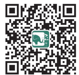
河南省教育厅微信公众号