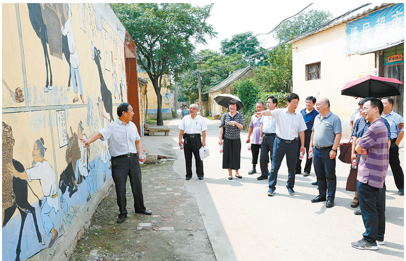
观看故事村石桥村故事壁画。