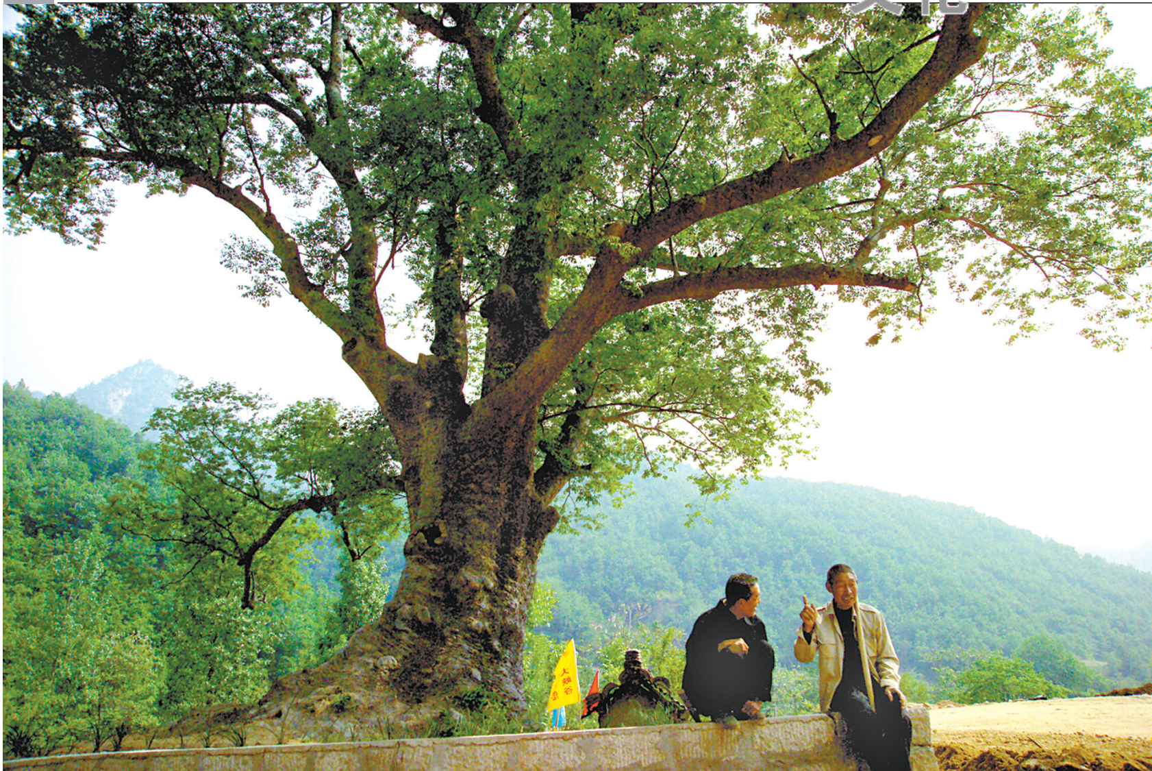
“故事婆子”在讲故事，民间故事就是以这种口口相传的方式传承下来的。

2019年12月25日，人民大会堂，《中国民间文学大系》出版工程首批成果发布会在这里举行。